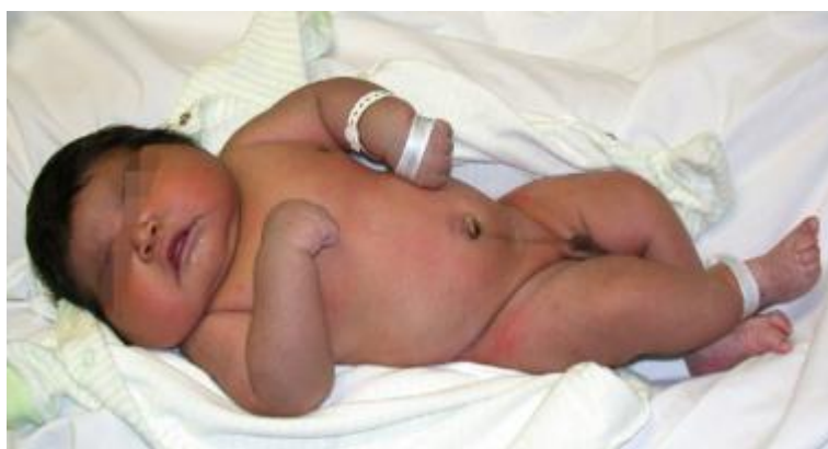
Slika 3: Makrosomno novorođenče kušingoidnog izgleda odmah nakon porođaja.

Na Slici 3 je prikazano dijete kušingoidnog izgleda.