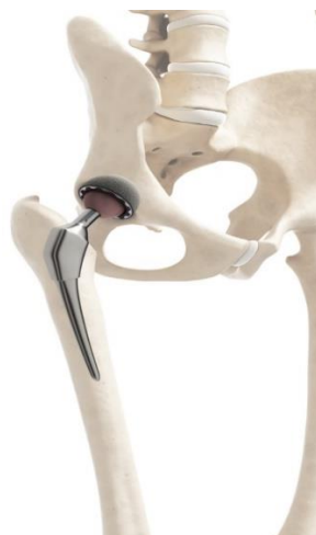
Slika 4. Totalna endoproteza