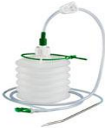
Slika 4.Redon dren