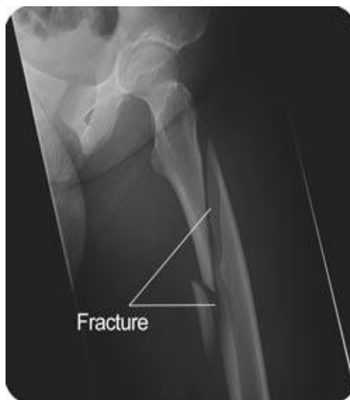
Slika 3. Prijelom bedrene kosti