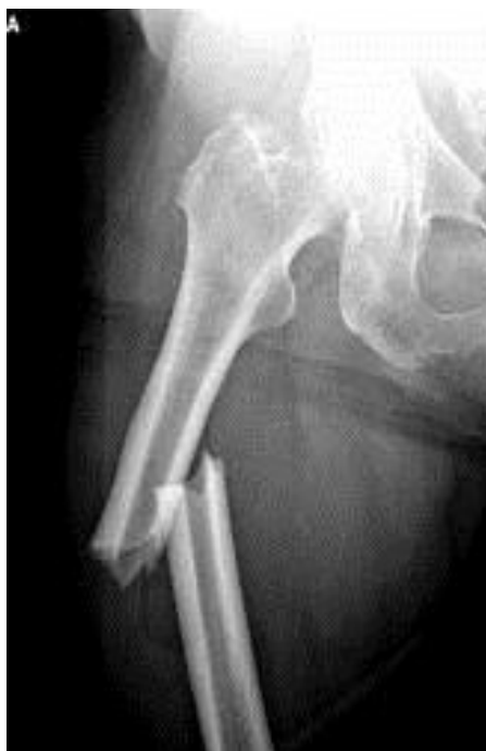
Slika 2. Prijelom bedrene kosti