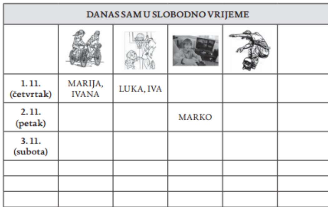
Slika 2. Primjer mjesečnog projekta tjelesne aktivnosti djece u četvrtom razredu osnovne škole (2).