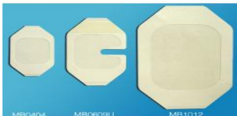
Slika 2. Prikaz „ klasične " pokrivke za SVK

Izvor: DRESSING TRANSPARENT (TEGADERM) I.V. FRAME