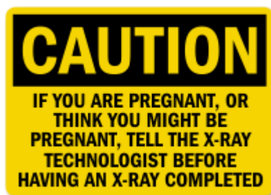
Slika 2. Upozorenje za trudnice

(1) Dijagnostički postupak uporabom radiofarmaceutskih pripravaka ne primjenjuje se na trudnicama i ženama koje doje, osim iznimno kad za neodgodivu primjenu tog postupka postoje opravdani zdravstveni pokazatelji po prosudbi doktora medicine odgovarajuće specijalnosti koji odobrava taj postupak, pri čemu utvrđuje uvjete provedbe tog postupka kojim će se osigurati najmanje moguće ozračenje pacijentice i djeteta, a da se pri tom dobiju dijagnostički podaci optimalne kakvoće.