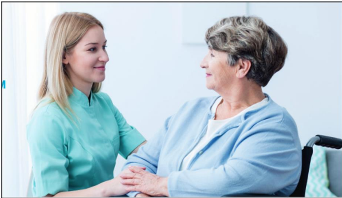
Slika 6. Pažljiv pristup i pomoć starijoj osobi

registrirati, uvažiti i potkrijepiti. U osjećajnu komunikaciju spada i predvidio izbjegavanje situacija koje iskustveno mogu dovesti do konflikata, a diplomatski ih se od njih može pokušati odvratiti tako da se oprezno promijeni tema razgovora. Ljudi s demencijom izgube sposobnost uviđanja uvjerljivih argumenata. Logična obrazloženja vrlo često i ne mogu shvatiti. Razgovori u svađi dovode do stresa i ljutnje na obje strane. Važno je ostati miran, ne započinjati diskusiju, ne korigirati i ne apelirati na uviđavnost. Potrebno je jačati im osjećaj vlastite vrijednosti pohvalama i priznanjima.