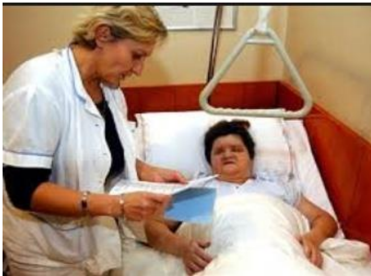
Slika 4. Čitanje uputa starijoj osobi oslabljenog vida

Osobe s oštećenjem vida su slijepa i slabovidne osobe. „Slijepoća označava medicinski poremećaj koji se izražava u djelomičnoj ili potpunoj nesposobnosti vizualnog sustava da prenosi podražaje, tj. kada je na „boljem“ oku prisutan ostatak vida od 5% i manje, stanje suženog vidnog polja te stanje u kojem osoba ne razlikuje svjetlo od tame. Može biti uzrokovana nasljednim faktorima, ozljedom ili bolešću.“(16)