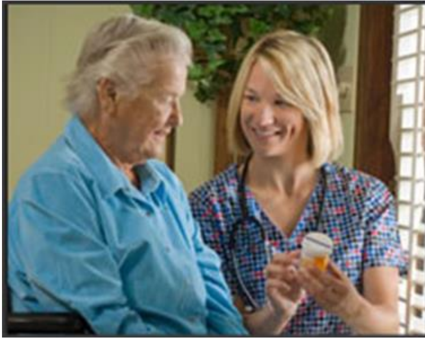
Slika 3. Pomoć starijim osobama oslabljenog sluha