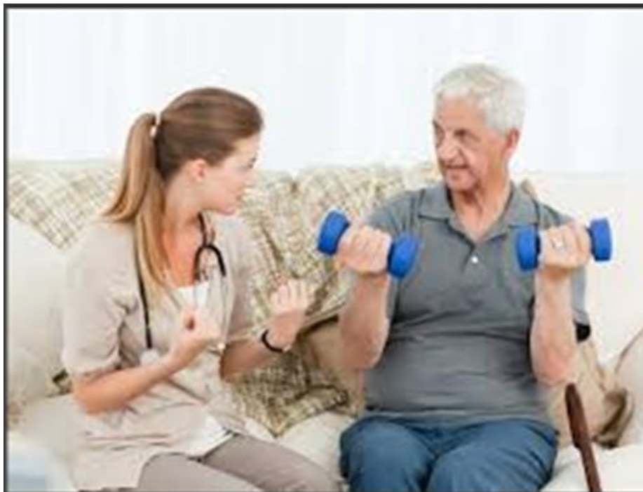
Slika 2. Edukacija i pomoć starijim osobama

Edukacija je neophodna da bismo starijim osobama omogućili povratak samopoštovanja i pomogli u povratku ili popravku kvalitete života. Starije osobe većinom imaju potrebu razumjeti svoje zdravstveno stanje, ali i pokazuju volju i želju da se nauče nositi s njime. Postoje i oni koji žele i traže uključenost treće osobe, što u velikom broju bolesti i situacija uistinu pomaže staroj osobi nositi se sa svojim stanjem. U tom slučaju to im je potrebno, ali i poželjno, omogućiti. Međutim, postoje i mnogobrojne situacije kad je uključenost treće osobe neophodna i opravdana, i to ne samo medicinski nego i pravno. Dakle, opisane su situacije regulirane ne samo etički i moralno nego i zakonski. Drugim riječima, moralno, etičko i zakonsko pravo potpune uključenosti u svoje liječenje ima i starija osoba, ako je to fizički i psihički u mogućnosti. U situaciji kad je starija osoba psihofizički zdrava, mora se poštovati volja starije osobe da informacije o njezinu zdravstvenom stanju budu tajne i uskraćene ostalim članovima obitelji. Nažalost, to pravo starije osobe često se ignorira, čime se krši osnovno ljudsko pravo takve osobe, samo zato što se radi o osobi treće životne dobi (14).