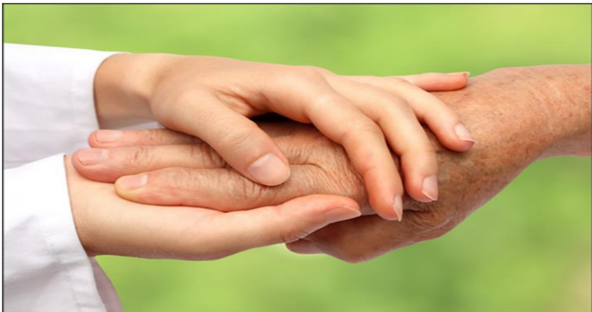
Slika 1. Briga o starijim osobama

Zdravstveni sistem je usmjeren na zaštitu zdravlja ljudi od njihovog rođenja do smrti, odnosno na čitav njihov životni vijek. U definicijama sestrinstva rečeno je da je umijeće sestrinstva međuljudski odnos i interakcijski proces između korisnika i sestre unutar socijalnog okruženja za vrijeme pružanja sestrinske skrbi. Najveći dio interakcija ostvaruje se međuljudskom komunikacijom. Adekvatno korištenje govora kao sredstva sporazumijevanja, jedna je od bitnih vještina koje bi medicinske sestre morale imati. Prvi dojam važan je za uspostavljanje međuljudskog odnosa, a o međuljudskom odnosu ovisi i uspješnost suradnje bolesnika u liječenju. Jedan od osnovnih ciljeva rada sestre jest usvajanje pozitivnog zdravstvenog ponašanja, ili pak mijenjanje loših navika i nepoželjnih ponašanja. Način na koji ljudi vide događaje ili određenu situaciju i značenje koje ta situacija ima za njih određuje i njihovu reakciju. Ako medicinska sestra i bolesnik pristupaju situaciji s jako udaljenim i različitim tumačenjima ili pretpostavkama, nerijetko može doći do nesporazuma. Često neke od bolesnikovih potreba vidimo kao prioritetne, no on ih sam možda tako ne vidi (1). Takve situacije mogu biti frustrirajuće za obje strane u terapijskom procesu, pa je potrebno da medicinska sestra i pacijent zajedno uspostave kvalitetnu komunikaciju koja će rezultirati na dobrobit obje strana.