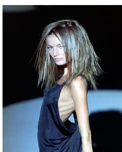
Slika 2. Model

Prema nekim podacima, poremećaji hranjenja se javljaju u oko 4 % adolescenata. AN je u posljednjem desetljeću sve češća, i to 20 puta više javlja kod djevojčica adolescentne dobi, nego kod dječaka (1). Prosječna dob početak bolesti je 17 godina, rijetko se javlja nakon 40. godine. Neki podaci upućuju na dva vrhunca, u dobi od 14 i 18 godina te je povezana sa stresnim životnim razdobljem, kao što je odlazak na studij (9). Prema nekim istraživanjima (9), smatralo se da je AN češća u višim društvenim slojevima. No, novija istraživanja (10) povezuju bolest s profesijama čiji je imperativ mršavost, kao što su balet i manekenstvo. Cjeloživotna prevalencija za AN iznosi 0.4-3.7%, a posljednjih godina je zabilježen njen porast među djevojčicama mlađim od 12 godina (10). Prevalencija kod žena u kasnijoj adolescentnoj i ranoj odrasloj dobi iznosi između 0.5-1%, a incidencija se povećala posljednjih desetljeća (9).