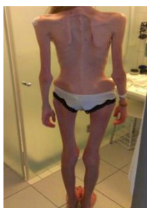
Slika 5. Potpuna devastacija mišićnoj i masnog tkiva

Imaju puno slatkiša, čak i po džepovima, a hrane ima svuda po kući. Troše puno vremena na uzimanje hrane, lome ju na vrlo male komadiće, te jedu vrlo polagano. Problem postaje sve vidljiviji, ali osobe odbijaju bilo kakav razgovor o svom problemu. Pojavljuju se povraćanje, bolovi u trbuhu, pretjerana izbirljivost, sporo jedenje i dugo zadržavanje hrane u ustima. Mnoge pacijentice imaju tjelesnu težinu od 35 do 40 kilograma bez obzira na visinu. Osobe su sklone perfekcionizmu, opsesivno kompulzivnom ponašanju, negativnim mislima, socijalno su izolirane, seksualno nezainteresirane, te postaju depresivne i anksiozne. U većini slučajeva bolesnici poriču da imaju problem i odbijaju liječenje. Na liječenje dođu kada okolina postane zabrinuta za njihov život, odnosno, kada je bolest uznapredovala i kada je već došlo do raznih tjelesnih promjena i komplikacija (11).