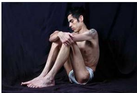
Slika 3. Manoreksija - anoreksija kod muškaraca