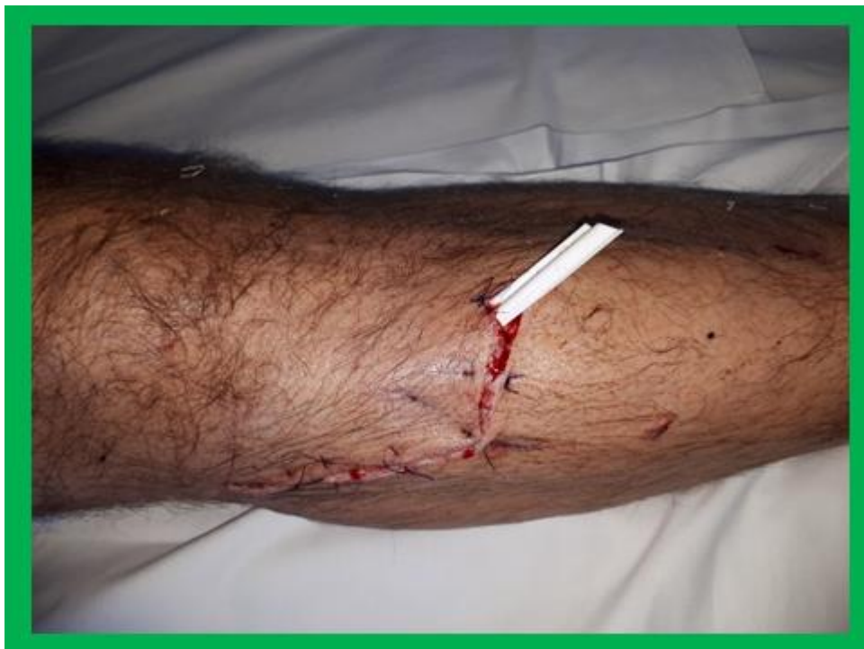
Slika 3. Otvorena drenaža potkoljenice