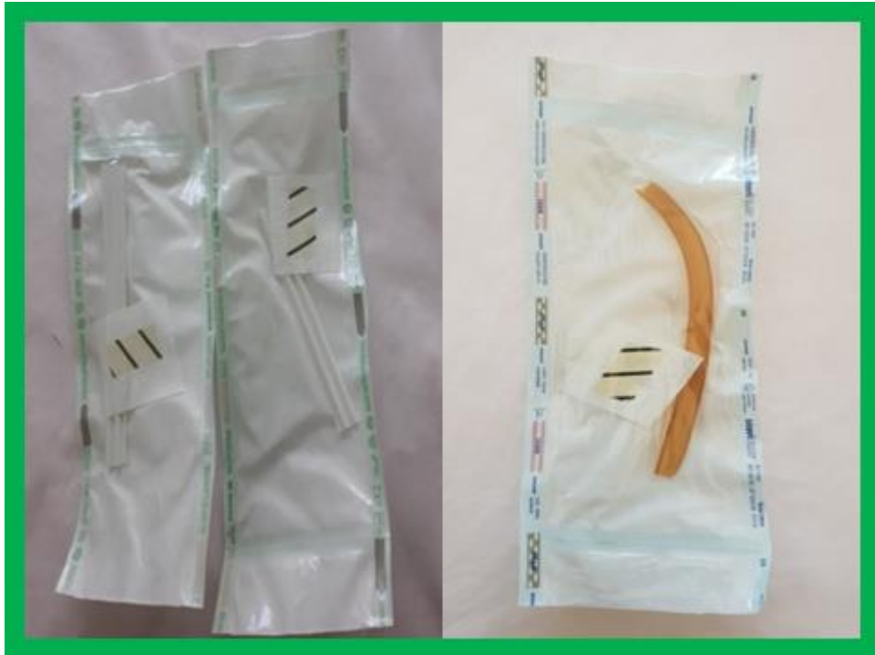
Slika 2. Drenovi za otvorenu drenažu