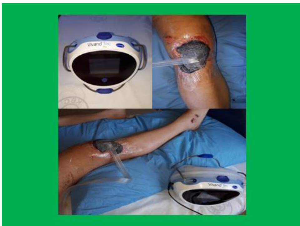
Slika 8. Aparat za drenažu s negativnim tlakom za inficirane rane i rane s obilnijom sekrecijom