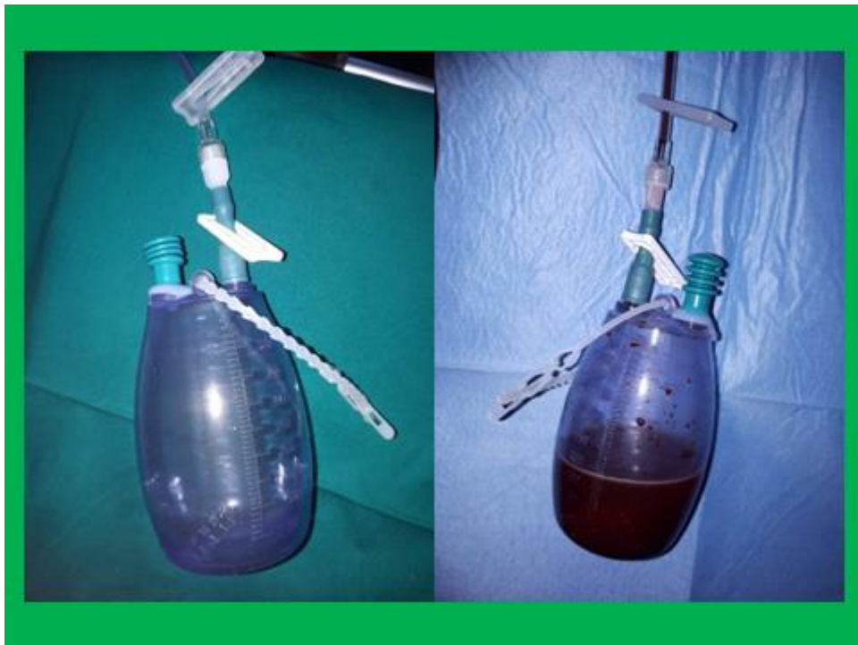
Slika 6. Spremnik sa negativnim tlakom