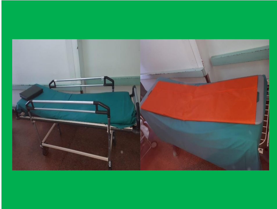
Slika 11. Zaštitne ograde i klizač za prijenos pacijenata

Sestrinski problemi i sestrinsko medicinski problemi u ovom razdoblju su (31):