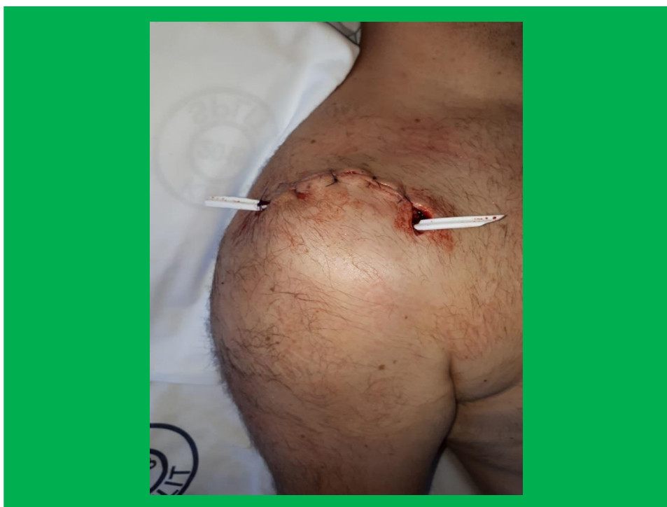
Slika 4. Otvorena drenaža ramena

Otvoreni drenovi (uključujući valovitu gumu ili plastične ploče) ispuštaju tekućinu u podlogu od gaze ili vrećicu od stome. Takva vrsta drenaže povećati će rizik od infekcije zbog mogućnosti ulaska mikroorganizama. Zbog toga se u novije vrijeme ovakva vrsta drenaže nastoji izbjeći.