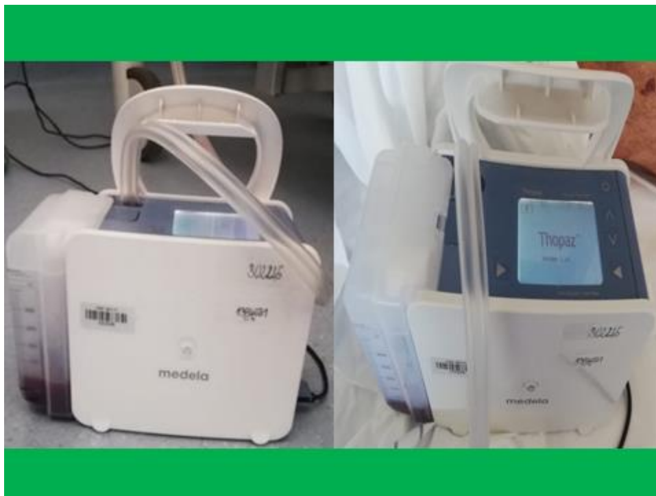
Slika 7. Aparat za torakalnu drenažu (torakalna pumpa)

Zatvorenu drenažu formiraju cijevi koje se odводе u vrećicu ili bocu. Primjeri uključuju torakalne, abdominalne i ortopedske kanale. Općenito, rizik od infekcije je smanjen.