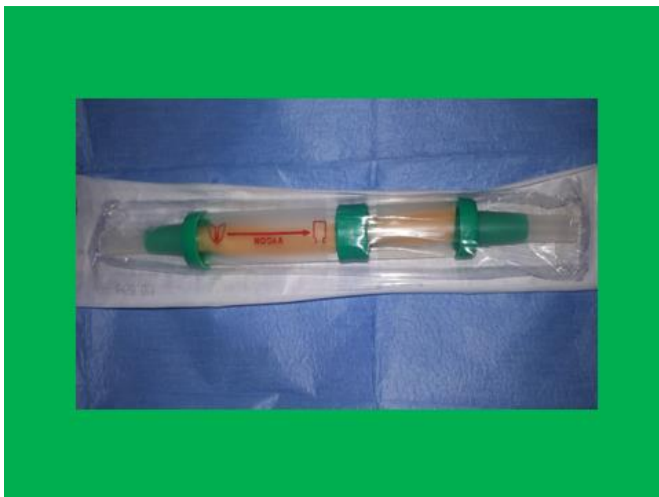
Slika 9. Haimichova valvula