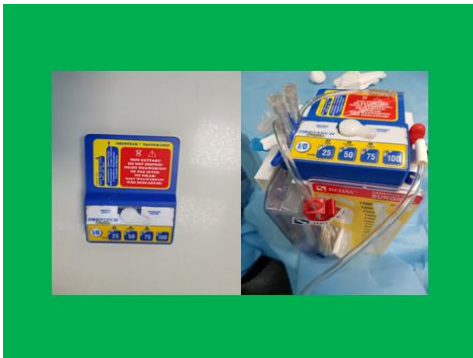
Slika 10. Uređaj za drenažu i postoperativno sakupljanje autologne krvi

Prilikom prebacivanja krvi iz sabirnog spremnika u vrećicu za krv, nije potrebno prespajati cijevi, tako da je čitav postupak siguran i sterilan te osigurava jednostavnu primjenu pravila asepse i antiseptike. Vakuumska jedinica omogućava da se kod prebacivanja krvi ne vadi vrećica iz kućišta, tako da ne dolazi do promjene krvnih parametara. Kako bi spriječili da lipidi iz površinskog taloga dospiju u vrećicu za krv, uređaj ima dvostruku komoru za odvajanje (16). Prilikom transfuzije autologne krvi, obavezno je vrećicu za krv izvaditi iz uređaja. Tijekom prebacivanja krvi u vrećicu za transfuziju sakupljene krvi, nije potrebno prekinuti postupak drenaže. Unutar vrećice se nalazi filtar od 40 \mu\text{m} koji dodatno filtrira krv tijekom transfuzije. Zahvaljujući nezavisnoj vakuumskoj jedinici, ovako koncipiran sistem može raditi pomoću vakuuma (sukcijska drenaža). Moguće je odabrati četiri jačine vakuuma u rasponu od -25 do -100 mmHg. Sistem ima veliku autonomiju koji mu omogućuje rad tijekom čitavog postoperativnog oporavka. Vakuumska jedinica sadrži i punjač za baterije. Za vrijeme sukucije, tekućinu i krv sakupljenu drenažom moguće je vidjeti direktno u sabirnom spremniku. Krv koja se nalazi u spremniku prošla je kroz filtar za makro nakupine i prema