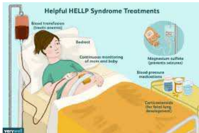
Slika2. Edukacijski plakat koji prikazuje tretmane u liječenju HELLP sindroma