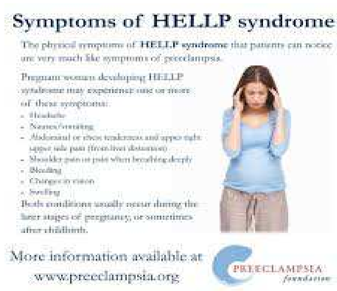
Slika1. Edukacijski plakat koji prikazuje simptome HELLP sindroma

Edukacija trudnice jedna je od uloga primalje. Potrebno je provesti informativni razgovor o periodu trudnoće u kojem se trudnica nalazi, osigurati pisanu formu edukacije u vidu brošura, letaka ili plakata u ordinaciji. Također, važno je i omogućiti trudnici dovoljno vremena i otvorena pitanja koja nam mogu ukazati na poteškoće u kojima se trudnica možda već nalazi.