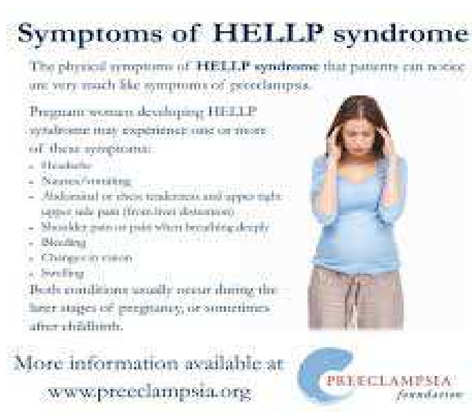
Slika1. Edukacijski plakat koji prikazuje simptome HELLP sindroma

Edukacija trudnice jedna je od uloga primalje. Potrebno je provesti informativni razgovor o periodu trudnoće u kojem se trudnica nalazi, osigurati pisanu formu edukacije u vidu brošura, letaka ili plakata u ordinaciji. Također, važno je i omogućiti trudnici dovoljno vremena i otvorena pitanja koja nam mogu ukazati na poteškoće u kojima se trudnica možda već nalazi.