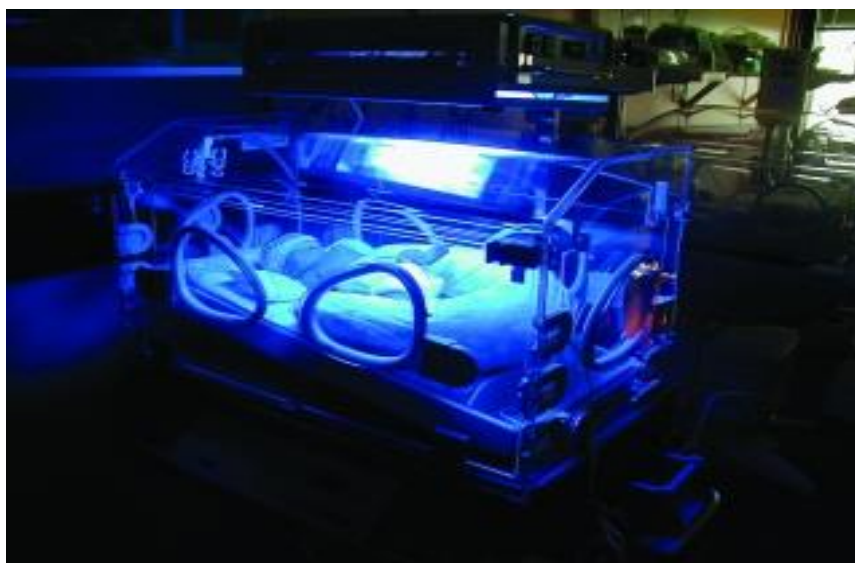
Slika 2:Novorođenče pod utjecajem fototerapije

i bijelih fluorescentnih svjetiljki. Učinkovitost se može postići i bijelim i plavim svjetlom, ali efikasnijim se smatra plavo.