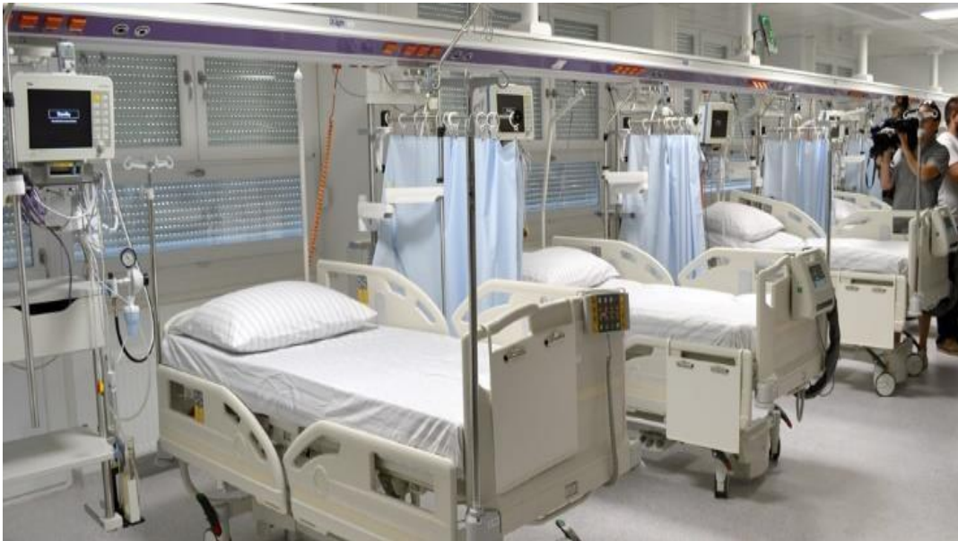
Slika 4. Neurokirurška intenzivna njega

Učestalost procjene ovisi o pacijentovom stanju. Potrebno je vršiti procjenu svako 1530 min, 8-12 h poslije operacije, te dokumentirati na temperaturnu listu. Trenutne rezultate procjene treba usporediti s nalazima po prijemu i prethodnim rezultatima i o svakom odstupanju obavijestiti liječnika (1).