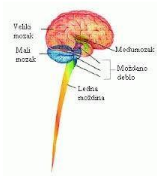
Slika 2. Dijelovi mozga