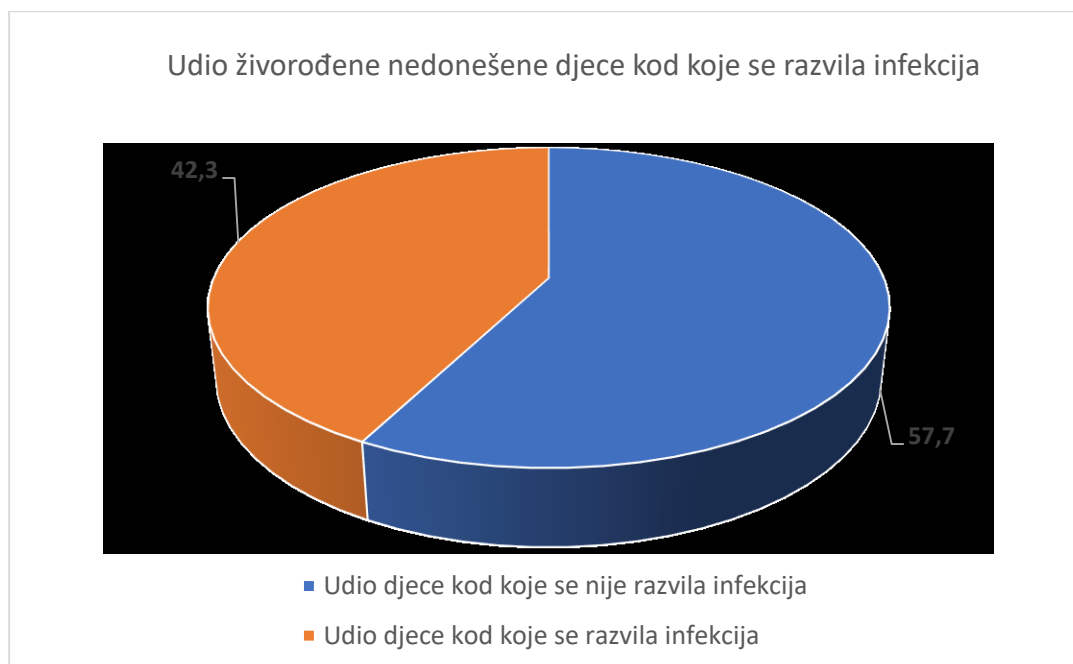
Slika 1. Grafički prikaz udjela ukupne analizirane živorođene nedonešene djece kod kojih se razvila infekcija te živorođene nedonešene djece bez infekcije (N=829)

Od ukupnog broja živorođene nedonešene djece tijekom trogodišnjeg razdoblja, 42,3% djece je razvilo infekciju, dok je 57,7% djece bilo bez infekcije (Slika 1).