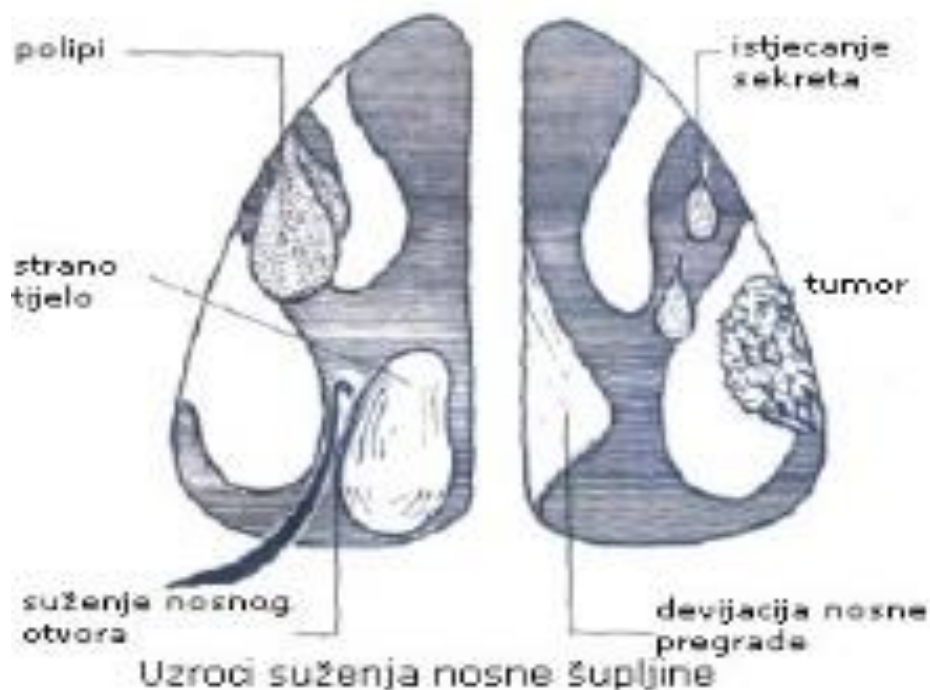
Slika 1. Uzroci suženja nosne šupljine

nerijetko susrećemo i druge patološke poremećaje (npr. septum nosa i polipi) koji dovode do komplikacija i problema u odvijanju normalnog rada receptora nosne šupljine, odnosno prirodnih i pravilnih funkcija respiratornog sustava (14). Premda je popis bolesti gornjeg respiratornog sustava veoma velik i dug u ovom radu se najčešće spominje devijacija septuma zbog relativno velike učestalosti i bitnog utjecaja na strujanje udahnutog zraka kroz nosnu šupljinu.