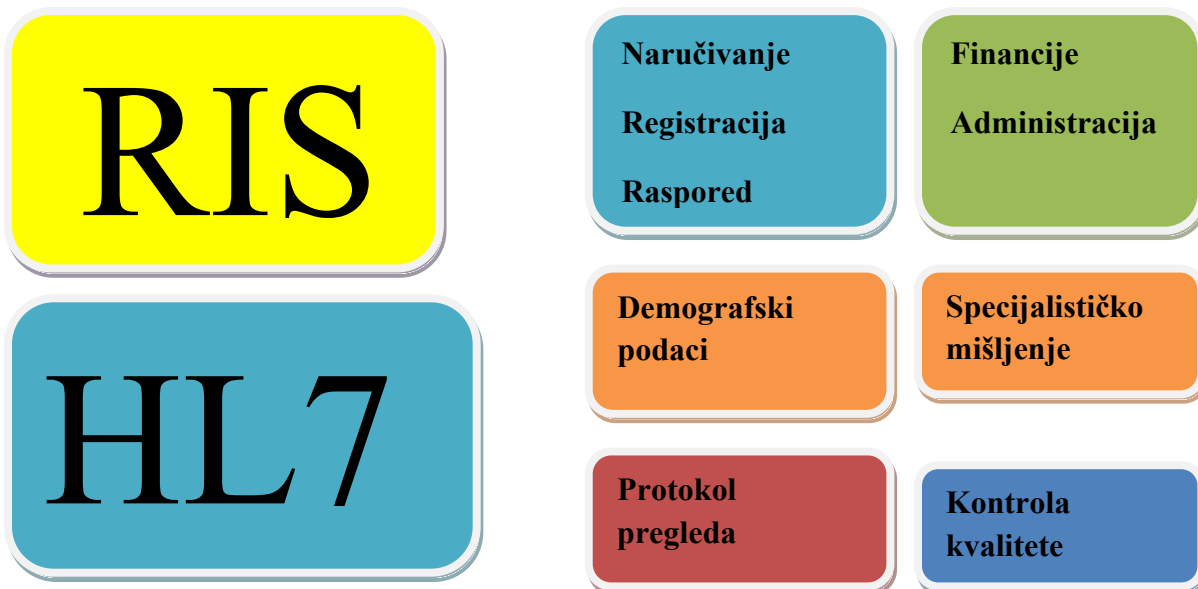
Slika 1. Shematski prikaz funkcionalnosti HL7 standarda unutar RIS-a

Svakodnevna upotreba modaliteta prilikom izvođenja raznih radioloških postupaka istiskuje potrebu za redovnom kontrolom svih parametara tijekom rada. Važnost se očituje u postizanju optimalnih rezultata kontrole kvalitete koja je zaslužna za postizanje kvalitetne i upotrebljive digitalne slike koja nosi visoku dijagnostičku vrijednost. Kontrola u radiološkom sustavu se prezentira mogućnostima prijave kritičnih rezultata provedenih mjerenja koji ne odgovaraju zadanim dopuštenim odstupanjima. Treba uzeti u obzir i kontrolu doze zračenja koja ima višestruke funkcije kako u slici tako i u samom tijeku rada (3). Bitno je provoditi kontrolu kvalitete na vrijeme i svaku relevantniju pogrešku upisati u sustav i prijaviti nadležnom tijelu radi ispravljanja iste. Zanemarivanje pogrešaka i ignoriranje očitih rezultata koji nisu u skladu s pravilima može dovesti do ozbiljnih posljedica štetnih ponajprije za pacijenta, a potom i za samo zdravstveno osoblje.