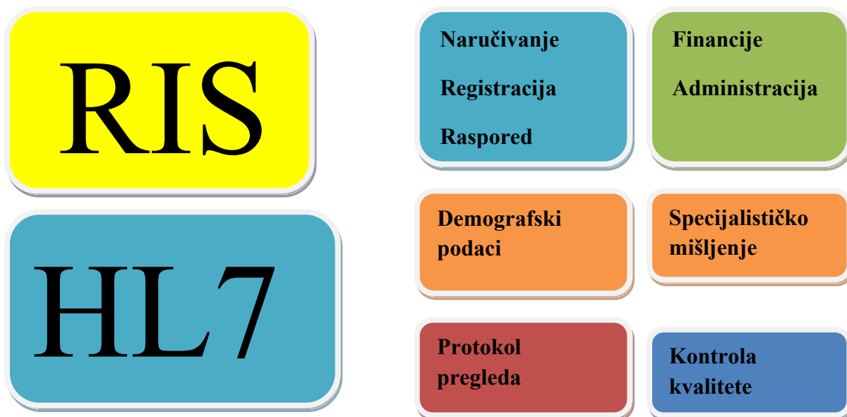
Slika 1. Shematski prikaz funkcionalnosti HL7 standarda unutar RIS-a

Svakodnevna upotreba modaliteta prilikom izvođenja raznih radioloških postupaka istiskuje potrebu za redovnom kontrolom svih parametara tijekom rada. Važnost se očituje u postizanju optimalnih rezultata kontrole kvalitete koja je zaslužna za postizanje kvalitetne i upotrebljive digitalne slike koja nosi visoku dijagnostičku vrijednost. Kontrola u radiološkom sustavu se prezentira mogućnostima prijave kritičnih rezultata provedenih mjerenja koji ne odgovaraju zadanim dopuštenim odstupanjima. Treba uzeti u obzir i kontrolu doze zračenja koja ima višestruke funkcije kako u slici tako i u samom tijeku rada (3). Bitno je provoditi kontrolu kvalitete na vrijeme i svaku relevantniju pogrešku upisati u sustav i prijaviti nadležnom tijelu radi ispravljanja iste. Zanemarivanje pogrešaka i ignoriranje očitih rezultata koji nisu u skladu s pravilima može dovesti do ozbiljnih posljedica štetnih ponajprije za pacijenta, a potom i za samo zdravstveno osoblje.