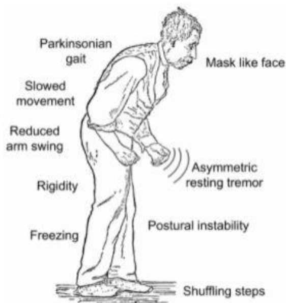
Slika 2. Motorički simptomi oboljelog od Parkinsonove bolesti.