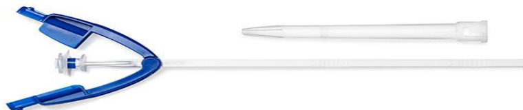
Slika 2. Provox® Vega

Provox®2 GP s kojom je omogućeno jednostavnije transoralno postavljanje (29). Danas na tržištu imamo i treću generaciju proteza, Provox® Vega SmartInserter (Slika 2).