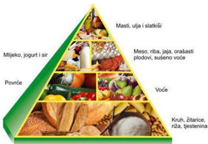
Slika 1: Prehrambena piramida.

Uloga je medicinske sestre da trudnoj ženi pomogne razumjeti važnost dobre prehrane za nju i fetus. Kako bi sestra motivirala ženu da poboljša ili promijeni svoje prehrambene navike, trudnica mora biti uključena u planiranje dnevnih jelovnika. Sestra mora težiti tome da trudnica iskreno surađuje. Pravilna prehrana možda neće eliminirati sve probleme u trudnoći, ali će se time učiniti ogroman korak u pravom smjeru.