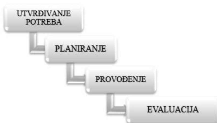
Slika 6. Faze procesa zdravstvene njege

Evaluacija je sustavna, planirana usporedba pacijentovih problema prije i poslije sestrinskih intervencija, a sastoji se od evaluacije ciljeva i evaluacije planova zdravstvene skrbi (17).