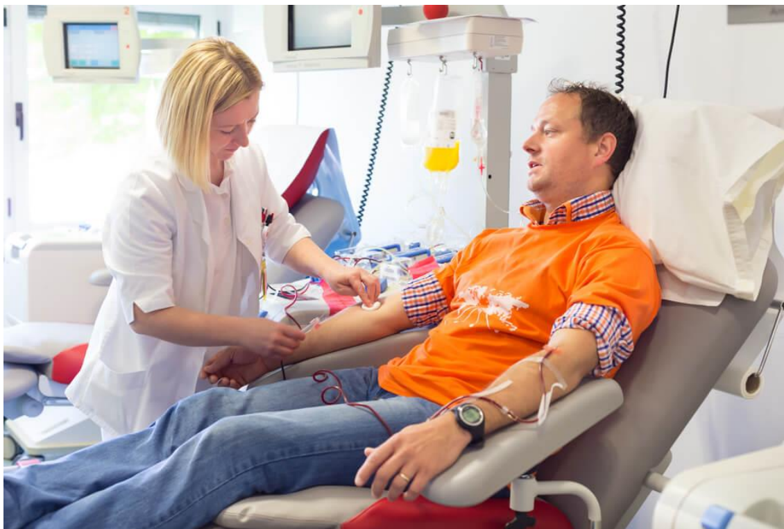
Slika 4. Postupak plazmafereze