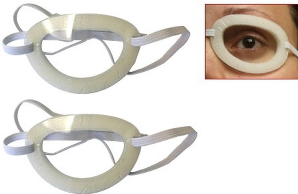
Slika 5. Komorice za zaštitu oka

Pacijenti s nemogućnošću potpunog zatvaranja oka zbog slabosti miškulature lica su u opasnosti od keratitsa (upala rožnice uzrokovana infekcijom ili ozljedom oka) (15). Dobra higijena rožnice korištenjem umjetnih suza, masti ili zaštitnim kapima za oči može biti od velike pomoći (15).