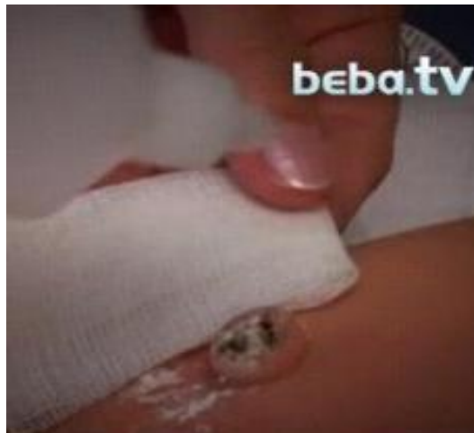
Slika 13. Postupak njege pupčanog batrljka

Zdravo se novorođenče od zdrave majke ne bi trebalo odvajati u rodilištu duže od jednoga sata dnevno i to samo za provođenje potrebnih medicinskih zahvata ili njege.