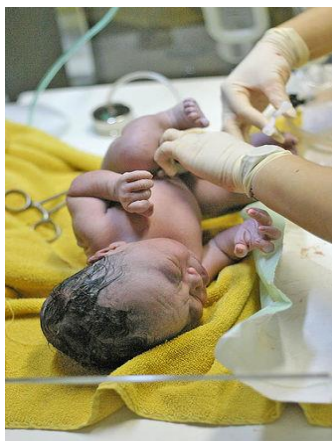
Slika 8. Prvo podvezivanje pupkovine novorođenčeta

Primalja pupkovinu podvezuje sterilnom štipaljkom 2-3 poprečna prsta od trbušnog zida novorođenčeta (penduculus abdominalis). Ako postoji pupčana kila, ta štipaljka je srazmjerno udaljena. 3-4 cm ispred vulve stavlja Pean koji će joj poslije biti pokazatelj odljuštenja posteljice, a ujedno pri presjecanju pupkovine sprječava istjecanje krvi iz posteljice. Presjecanje pupkovine se obavlja sterilnim i oštrim škarama zaobljenog vrha, 4-5 mm iznad sterilne štipaljke, a pri tome se rukom zaštititi novorođenče od mogućih povreda. Ostatak pupkovine na strani novorođenčeta zamotamo sterilnom gazom ili zavojem, jer je vrlo podložan infekciji. Sa kože novorođenčeta se otkloni krv i plodova voda sterilnom kompresom.