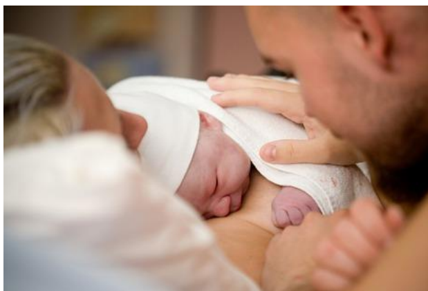
Slika 9. Prvi kontakt koža na kožu majke i novorođenčeta

Sa kože novorođenčeta se otkloni krv i plodova voda sterilnom kompresom, te se neposredno nakon toga novorođenče pokaže majci da vidi spol i stavi na njena prsa. Majka se upoznaje sa svojim djetetom, prekinuta veza se nastavlja između majke i novorođenčeta, funkcija dojenja što prije uspostavlja i digestivni trakt novorođenčeta kolonizira mikroorganizmima sa kože majke. Za novorođenče je važno da se najprije susretne sa majčinim, a ne bolničkim mikroorganizmima. Ovaj put može predstavljati psihofiziološko „osjetljivo razdoblje“ za programiranje buduće fiziologije i ponašanja novorođenčeta.