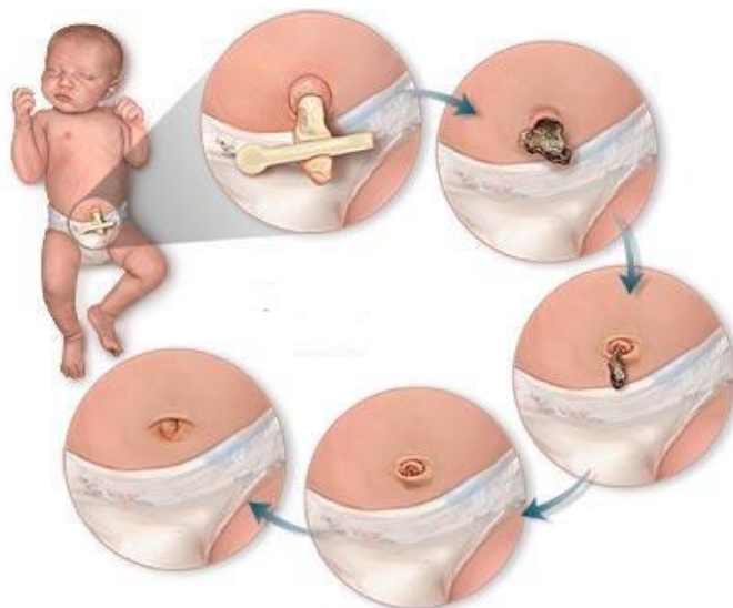
Slika 15. Proces otpadanja pupčanog batrljka i cijeljenja pupčane ranice

života, a pupčana ranica može još nekoliko dana vlažiti, da bi na kraju epitelizirala i osušila se.