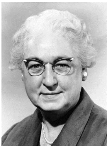
Slika 10. Dr. Virginija Apgar

Ocjenu vitalnog stanja novorođečeta osmislila je Dr. Virginia Apgar . V. Apgar je prva žena koja je postala redoviti profesor na Sveučilištu „ Columbia College “ liječnika i kirurga, te je 1952.god. dizajnirala prve standardizirane metode za procjenu prijelaza novorođenčeta u život izvan maternice - Apgar ocjenom. Kao jednostavna i lako ponovljiva metoda, za brzo procjenjivanje zdravlja novorođenčadi odmah nakon rođenja (10).