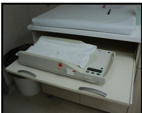
Slika 4. Digitalna vaga

Vaga za mjerenje tjelesne težine i dužine treba biti namještena na nultu vrijednost.