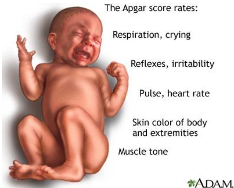
Slika 11. Parametri koji se ocjenjuju kod Apgar score-a