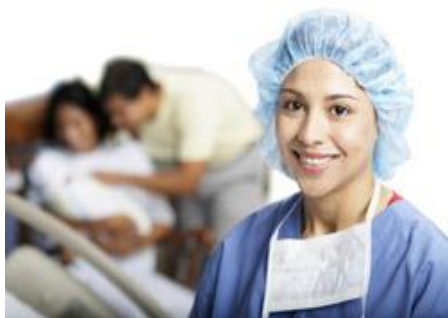
Slika 6. Medicinska sestra / primalja

Članove tima za prvu njegu novorođenčeta čini primalja te pedijatar. Za postupak prve njege novorođenčeta pripremaju se tako što pored propisane radne odjeće i obuće, oblače sterilni mantil te kiruršku kapu i masku. Potom, izvrše higijensko pranje i higijensku dezinfekciju ruku, kao i zaštitu ruku sterilnim rukavicama.