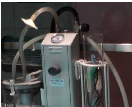
Slika 3. Aspirator

Oprema za reanimaciju treba također biti lako dostupna ili pripremljena.