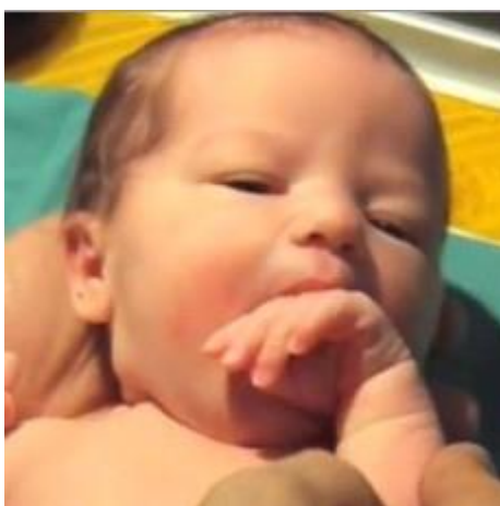
Slika 18. Refleks sisanja

Refleks sisanja - javlja se u primitivnom obliku već u fetusa od 10 tjedana, a postoji sve do 4. mjeseca života. Stavi li se djetetu bilo kakv predmet u usta, ono će reagirati intenzivnim pokretima sisanja, time automatski potiče kod proizvodnju i izlučivanje mlijeka. Negdje oko 4. mjeseca dijete savlada traženje hrane pogledom i gestama pa se ovaj refleks u tom razdoblju potpuno gubi.(4)