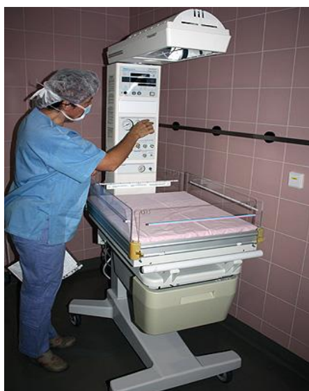
Slika 2. Stol za reanimaciju

Optimalni mikroklimatski uvjeti postižu se podizanjem temperature i vlažnosti u prostoru, u okviru raspoloživih tehničkih mogućnosti. Bebi-term (reanimacijski stol) ili pult sa grijačem, i/ili inkubator uključeni su na princip grijanja do 34 °C.