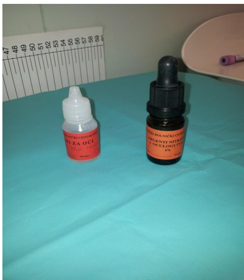
Slika 12. 1% argenti nitrat i sterilna aqua za ispiranje očiju (KBC Split)