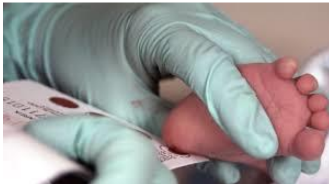
Slika 16. Postupak vađenja krvi za biokemijski probir (Guthrie test)

napomenom da se pretraga za skrining učini do kraja drugog tjedna života u nadležnoj pedijatrijskoj ambulanti, u ambulanti opće medicine ili da je učini patronažna sestra (6).