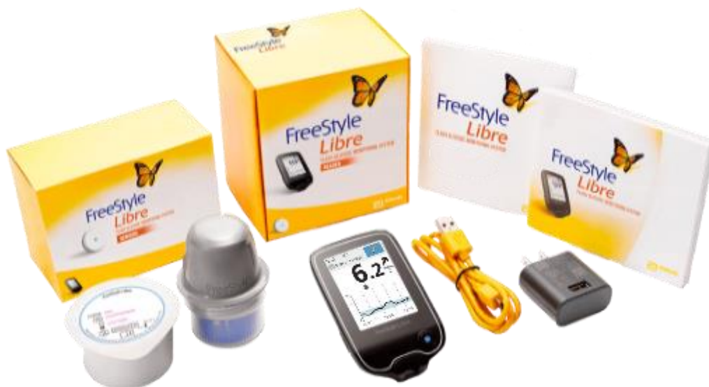
Slika 1. Dijelovi FreeStyle Libre sustava (19)

Slika 1 prikazuje dijelove FreeStyle Libre sustava u koje ubrajamo mjerач, senzor, aplikator senzora, punjač za punjenje mjerачa te upute za pravilno korištenje.