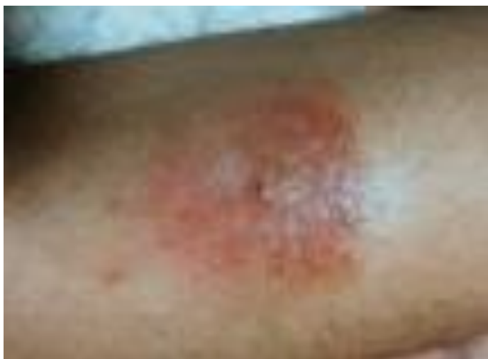
Slika 3. Alergijski kontaktni dermatitis na mjestu aplikacije FreeStyle Libre senzora (21)

Mnoga istraživanja prikazala su povezanost korištenja senzora sa pojavom promjena na koži apliciranog mjesta. Najčešća promjena na koži tijekom korištenja senzora je alergijski kontaktni dermatitis. Pacijenti koji su pokazali znakove alergijskog dermatitisa testirani su flasterom s osnovnom serijom na kojem se nalazi izobornil akrilat različitih koncentracija, a na senzoru se provela kromatografija. Na takvo testiranje i na ljepljivi dio senzora, reagirali su svi testirani pacijenti i pokazali osjetljivost na izobornil akrilat, a provedena kromatografija dokazala je prisutnost istog akrilata u senzoru (20).