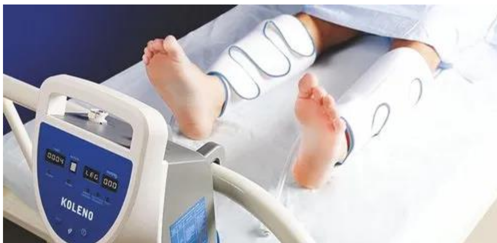
Slika 7. IPC