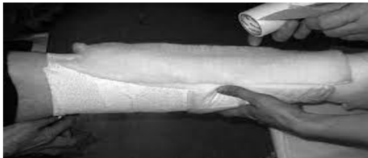
Slika 6. Postavljanje kratko-elastičnog zavoja

Postavljanje se počinje zavojem koji je rastezljiv po duljini (samo za kompresiju potkoljenice) tako što je početak zavoja na strani pete, zatim sredina zavoja prelazi preko fleksorne strane skočnog zgloba, a onda preko sredine pete prema dolje i prema stopalu do prstiju. Nakon toga nastavljamo u obliku osmice natrag preko pete, te kružno na potkoljenicu do ispod koljena. Drugi zavoj se upotrebljava za postizanje kompresije na bedru, a njega postavljamo tako što počinjemo ispod koljena, na mjestu gdje smo sa prethodnim zavojem završili i kružno ga stavljamo prema bedru. Kod opsežnog edema se ispod tih zavoja postavi se zavoj širine 10 cm, koji između dva sloja ima nalijepljene pjenaste jastučice. Zavoj se pričvrsti svilenom trakom posvuda gdje se nalaze završetci zavoja (14,15,16).