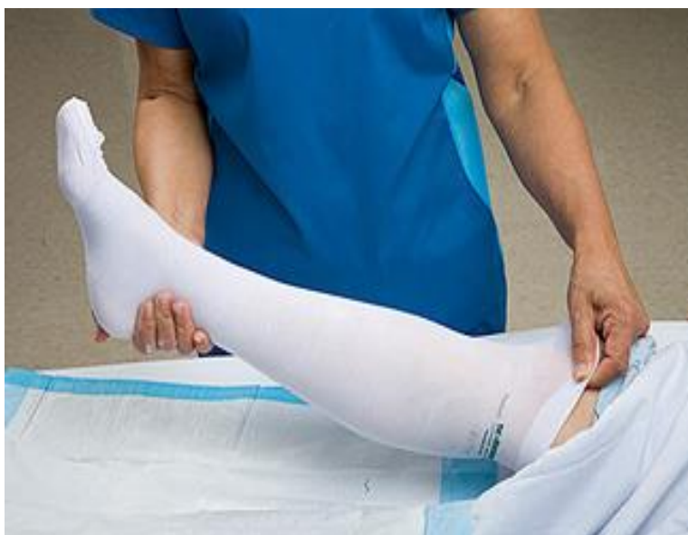
Slika 4. Kompresivne čarape