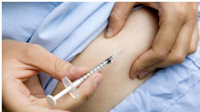
Slika 8. Primjena subkutane injekcije