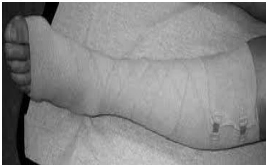
Slika 5. Postavljena kompresijska terapija

Ponekad su potrebna 2 zavoja za dobru kompresiju, drugi zavoj se postavlja na isti način. Kontraindikacija za postavljanje ovog zavoja su smetnje arterijske cirkulacije (15).