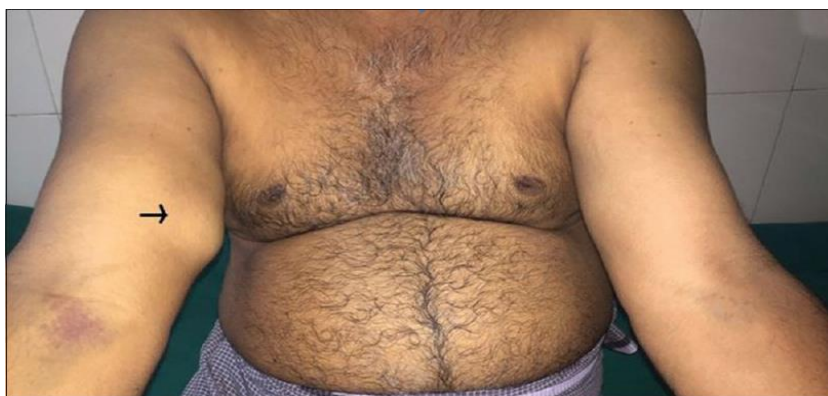
Slika 1. Prikaz duboke venske tromboze desne ruke