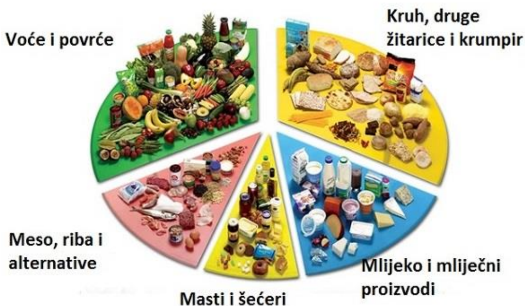
Slika 3. Udio namirnica u DASH dijeti

– 6 g natrijevog klorida) ili manje (28). DASH dijeta ne utječe samo na vrijednosti krvnog tlaka, nego i na ostale faktore rizika uključujući vrijednosti glukoze u krvi natašte i ukupnog kolesterola (27). Iako je ovakav tip prehrane osmišljen prvenstveno za osobe s hipertenzijom, pogodan je za prehranu cijele obitelji, na koji se način mjere prevencije kardiovaskularnih bolesti proširuju na značajno veći dio populacije.