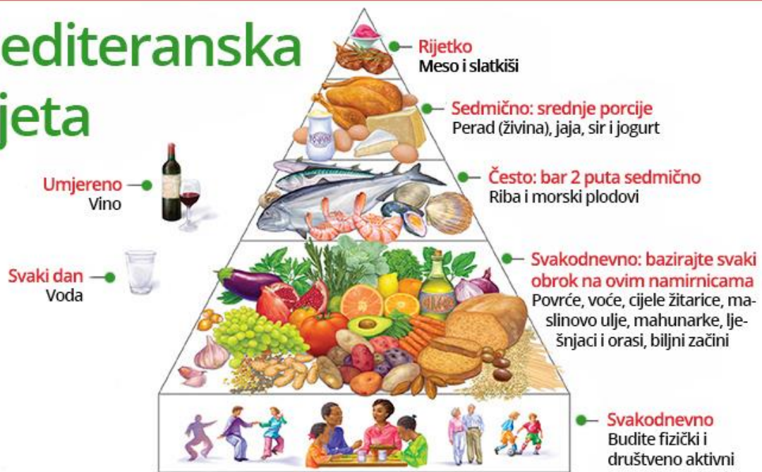
Slika 2. Piramida mediteranske dijete