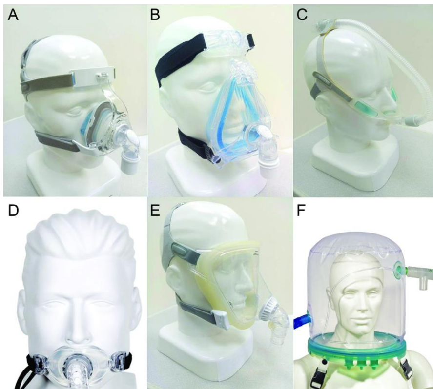
Slika 3. Vrste neinvazivne ventilacije