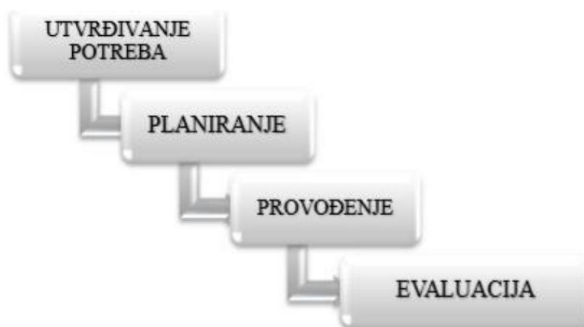
Slika 4. Faze u procesu zdravstvene njege

Četvrta i posljednja faza procesa zdravstvene njege je evaluacija zdravstvene njege. Evaluacija je usporedba aktualnog i realnog stanja pacijenta, psihičkog i fizičkog, sa onim unaprijed opisanim koji je bio definiran ciljevima. Uključuje evaluaciju cilja i evaluaciju plana zdravstvene njege(26). Ukoliko cilj nije postignut koji smo unaprijed postavili kod planiranja zdravstvene njege onda se cijeli plan revidira od prve faze prema zadnjoj, kako bi se mogao ponovo korigirati ili planirati, provesti novi plan i učiniti ponovnu evaluaciju na kraju (25).