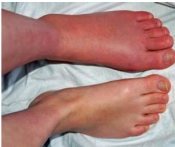
Slika br.6 Eritem CRPS