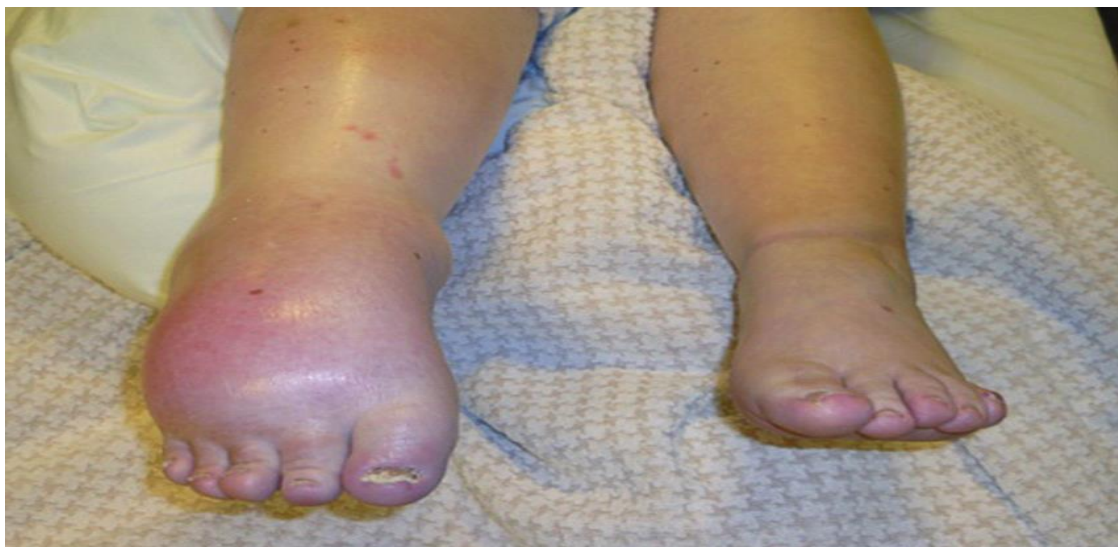
Slika br. 2.