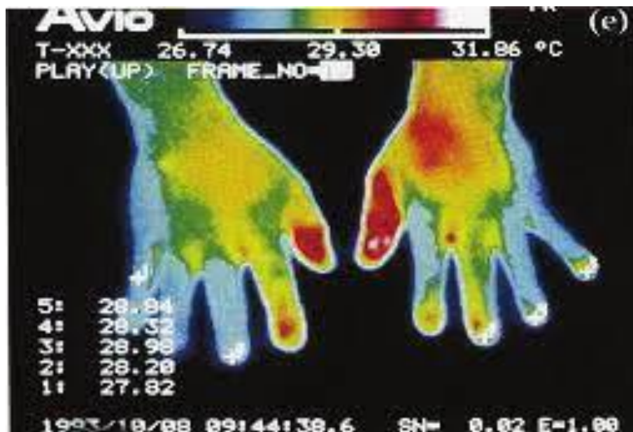
Slika br.3 Scintigrafija

Scintigrafija kostiju — Scintigrafija kostiju (tj. skeniranje kostiju) je osjetljiva tehnika za otkrivanje bilo kojeg velikog broja poremećaja kostiju, zglobova i periartikularnih poremećaja, uključujući prijelome, infekcije, tumore, artritis i metaboličke bolesti kostiju. Troetapna scintigrafija kosti korisna je za otkrivanje promjena u metabolizmu kostiju u bolesnika s CRPS-om koji imaju aktivnu resorpciju kosti. Iako je CRPS klinička dijagnoza koja ne ovisi o rezultatima slikovnih studija, scintigrafija kostiju izvedena unutar prvih pet mjeseci nakon pojave simptoma može poduprijeti dijagnozu ako postoji povećani (ipsilateralna > 1,32 u usporedbi s kontralateralnom) unos radiofarmaka kvantitativnom procjenom u područja od interesa tijekom faze mineralizacije (tj. treće) u zglobovima oko mjesta traume. Važno je napomenuti da negativan sken kostiju ne isključuje dijagnozu CRPS-a.