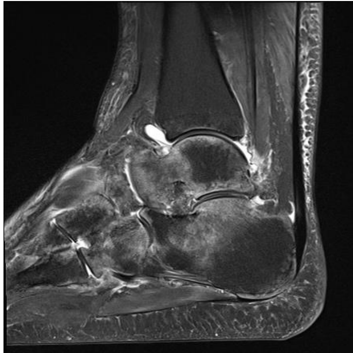
Slika br.5 MR CRPS-a

Povijesno gledano, naglo prolazno ublažavanje boli i disestezije sa sustavnom kemijskom simpatolizom (tj. intravenozna regionalna anestezija, također nazvana "Bierov blok" i/ili regionalni blok simpatičkog živca kao što je zvjezdasti ganglion ili lumbalni simpatički blok živaca) smatralo se neophodnim za postavljanje dijagnoze CRPS-a. Međutim, kako uloga simpatičkog živčanog sustava u patogenezi CRPS-a ostaje nejasna i kontradiktorna, sada je široko prihvaćeno da pozitivan odgovor na simpatičku blokadu nije dijagnoza CRPS-a. Umjesto toga, takav je odgovor važan pokazatelj simpatički održavane boli.