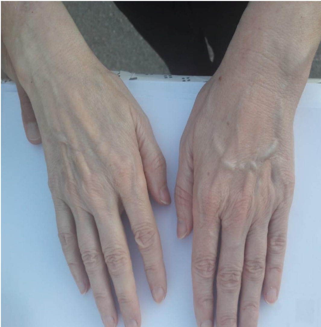
Slika br. 9

Na slici br. 9 možemo primjetiti razliku u volumenu desne i lijeve ruke pa čak i promjene u boji kože ( desna ruka je blago blijeđa boje nego lijeva). 3. DIP je blago otečen kao 4. i 5. MCP. Vidimo blage promjene na površini noktiju ; boja noktiju je drugačija u odnosu na desnu.