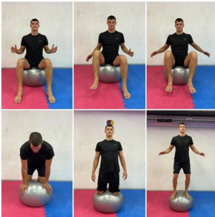
SLIKA 4. Progresija na pilates lopti