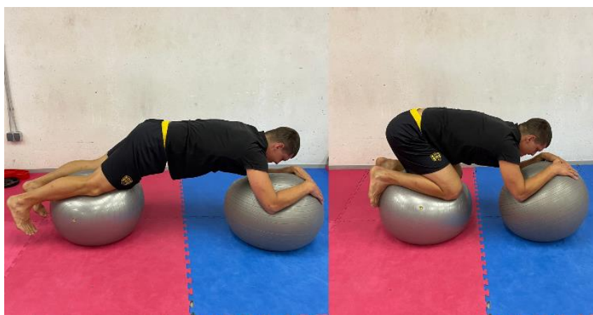
SLIKA 5. Propriocepcijske vježbe i vježbe jakosti na dvije pilates lopte