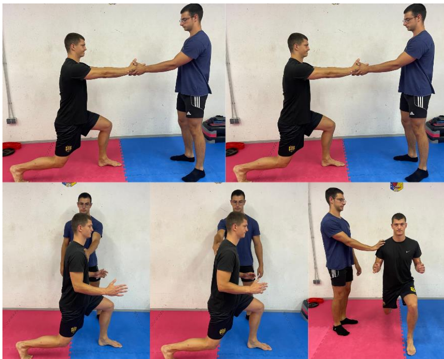
SLIKA 3. Testiranje stabilnosti u tri ravnine.

ciljano povećamo volumen vježbi za mišićnu grupu u koja se pokazala najslabijom. Test se izvodi u iskoraku jer se čovjek prilikom hoda, trka i ostalih svakodnevnih aktivnosti najčešće kreće kontralateralno.