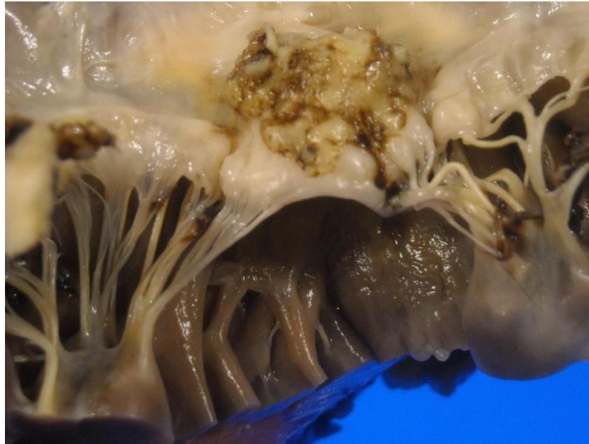
Slika 1. Prikaz infektivnog endokarditisa sa velikom vegetacijom na atrijalnoj valvuli