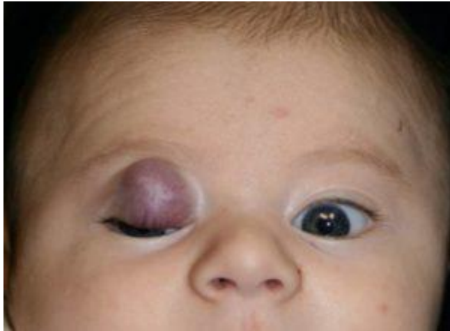
Slika 2. Hemangiom na području oka