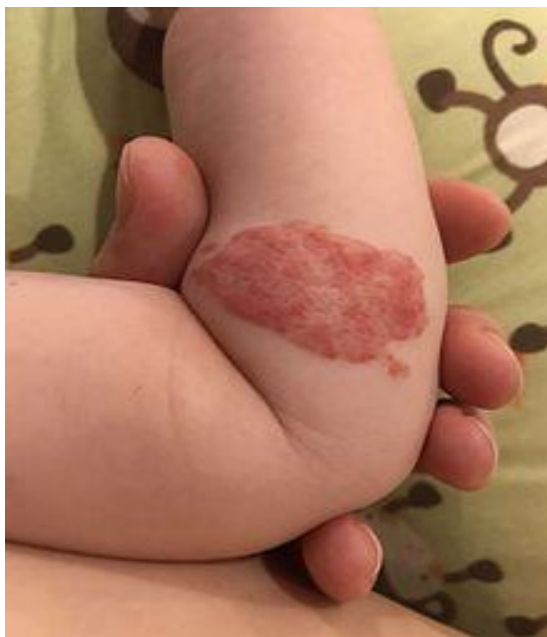
Slika 4. Hemangiom na ruci djeteta