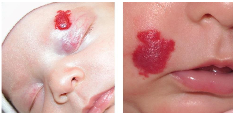
Slika 1. Prikaz dojenačkih hemangioma na licu djeteta