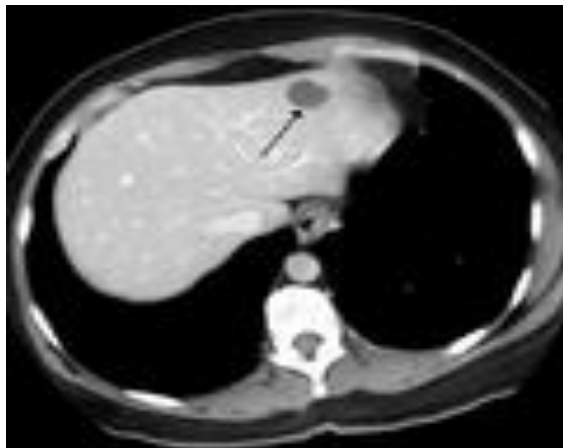
Slika 3. Hemangiom na jetri, CT prikaz