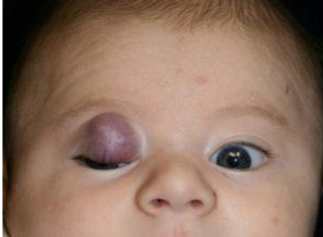
Slika 2. Hemangiom na području oka