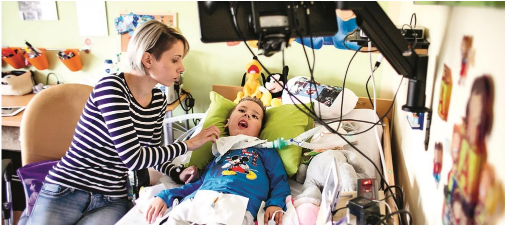
Slika 3: Dijete s traheostomom u kućnom okruženju