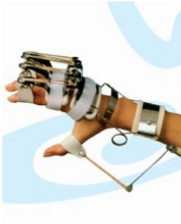
Slika 15 Funkcijska ortoza za šaku

Funkcijske ortoze primjenjuju se na razini zapešća i šake. Nadomještaju izgubljenu funkciju i na taj način omogućuju hvat. Statički dijelovi ortoze izrađeni su od termoplastičnih materijala i povezani mehaničkim zglobovima. Dinamički dijelovi su opruge, metaln žice ili neki drugi elastični materijal.