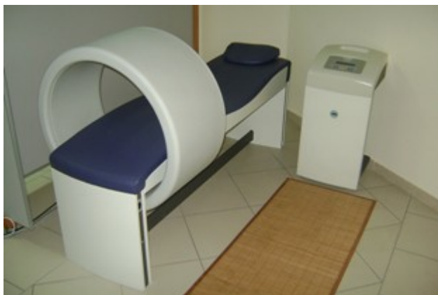
Slika 12 Uređaj za primjenu magnetoterapije

Magnetoterapija je fizikalnoterapijska procedura koja koristi magnetno polje u svrhu liječenja. Magnetno polje nastaje intermolekularnim kružnim strujanjem zbog brze promjene električnog polja. (3) Ono prodire u dubinu tkiva i utječe na biološke sustave te stvara mnoge pozitivne reakcije kao što su povećanje energijskog metabolizma i parcijalnog tlak kisika. Ove promjene dovode do bolje prokrvljenosti tretiranog dijela te posljedično do ubrzanog zarastanje i reparacije tkiva. Doziranje magnetoterapije u literaturi nije točno određeno pa tretman može trajati od nekoliko minuta pa čak i do nekoliko sati. U načelu se u akutnim stanjima primjenjuje manji intenzitet i kraće trajanje procedure, dok je kod kroničnih stanja potreban veći intenzitet i duže trajanje.