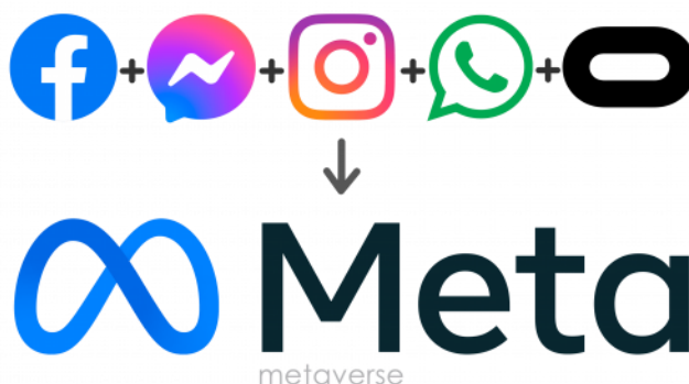
Slika 5. Logo tvrtke „Meta technologies“

U sastavu „Meta tehnologija“ svrha „Instagram“ aplikacije je da inspirira ljude svaki dan. To je aplikacija gdje se njeguje sigurna i inkluzivna online zajednica u kojoj se ljudi mogu izraziti, osjećati se bliže svima do kojih im je stalo i pretvoriti strast u život. (11).