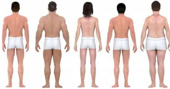
Slika 2. Slika različitih oblika muškog tijela. Idealno muško tijelo ponajviše prikazuju prvi i drugi 3D model.