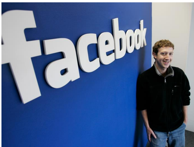
Slika 3. Mark Zuckerberg

Mark Zuckerberg je osnovao 2004.godine „Facebook“ koji postaje najpopularnija internetska mreža s preko 2 milijarde korisnika (10). „Facebook“ omogućuje povezivanje s prijateljima, obitelji i zajednicama ljudi koji dijele zajedničke interese. Povezivanje sa prijateljima i članovima obitelji, kao i otkrivanje novih prijatelja je jednostavno sa značajkama kao što su Facebook Grupe kojima se mogu priključiti mnogobrojni članovi, Facebook Watch koji omogućuje da gledate razne video sadržaje i Marketplace, online trgovinu gdje postoji mogućnost kupovine, prodaje materijalnih stvari te međusobne komunikacije među korisnicima. S online prijateljima postoji mogućnost razgovora, promatranje i komentiranja međusobnih objava, bilo to fotografija ili videozapisa (11).