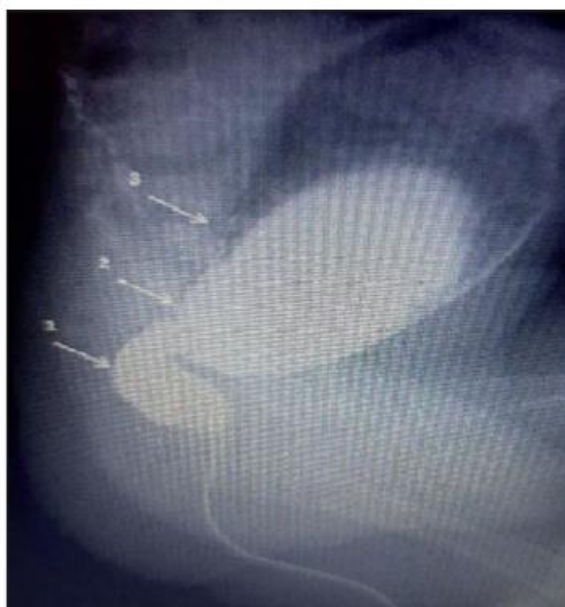
Slika 2. Radiografija novorođenčeta s Hirschsprungovom bolešću s kontrastom.

odsutnost ganglijskih stanica u živčanim pleksusima intermuskularnog i submukoznog sloja rektuma kada se boje hematoksilin-eozinom. Histokemijska analiza biopsije rektalne sluznice otkriva prisutnost acetilen-pozitivnih hipertrofiranih živčanih vlakana, što potvrđuje HSCR (slika 2). Histokemijska reakcija na ACE za dijagnozu HSCR-a u novorođenčadi ima osjetljivost od 91%, specifičnost od 100%, lažno negativan rezultat opažen je u 8% slučajeva. Novorođenčad, osobito nedonoščad, čak i kod HSCR-a može imati smanjen broj živčanih vlakana u crijevnoj stijenci, pa smanjenje razine ACE – pozitivnih vlakana u novorođenčadi može dovesti do lažno negativnog nalaza. Međutim, unatoč ovim ograničenjima, rektalna biopsija je osjetljivija i specifičnija od kontrastnog klistira i anorektalne manometrije zajedno (9).