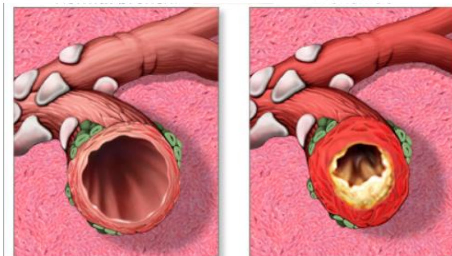
Slika 2. Prikaz zdravog bronhija i bronhija zahvaćenog infekcijom

nerijetko zahvaća i donji dio dišnog sustava (dušnik, bronhe i pluća). Bronhitis je upala bronha, obično uzrokovana infekcijom. Ova iritacija može uzrokovati jake napade kašlja koji stvara sluz, hripanje, bol u prsima i otežano disanje (7).