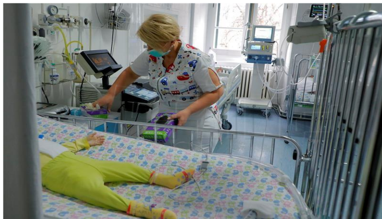
Slika 4. Medicinska sestra u skrbi za dijete