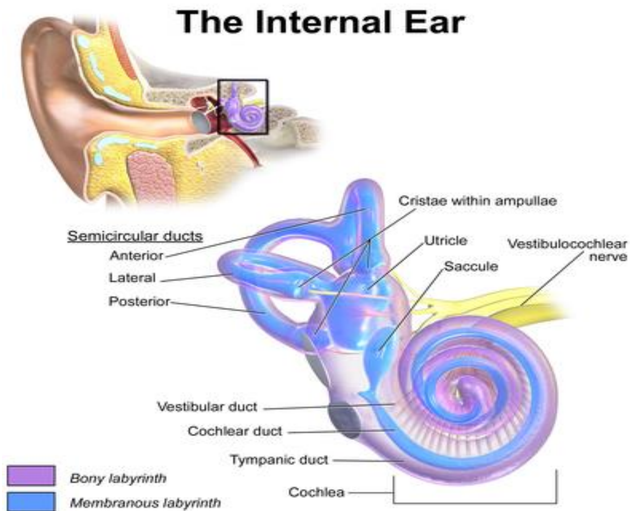
Slika 2. Prikaz anatomije unutarnjeg uha

oko 5 mm u kojem se nalaze osjetni organi ravnoteže. Polukružni kanali, poznati i kao tri polukružna koštana kanala (lat. canalis semicircularis anterior, posterior et lateralis), imaju oblik savijenih struktura koje čine oko 2/3 kruga i postavljeni su tako da se međusobno nalaze pod pravim kutem. Ova konfiguracija stvara složeni trodimenzionalni koordinatni sustav koji ima ključnu ulogu u njihovoj funkciji u osjetu ravnoteže (7).