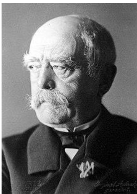
Slika 2 Otto von Bismarck