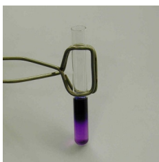
Slika 10. Duquenois-Levine test, korak 3., dodavanje kloroforma (izvor: Wikipedia)

Primjer 2. Pripremljeni sirovi uzorak tj. njegov dio mase 0,0001 grama je podvrgnut spot-test metodi, tj. reakcijama, kojima se u osnovi uglavnom testiraju praškasti materijali ili njihovi ekstrakti. Najčešćireagens koji se koriste u tu svrhu i na osnovu čije bojene reakcije se možete opredijeliti za dalji tok analize i izbor metoda je Marquis reagens (2,5 ml konc. H_2SO_4 i par kapi formaldehida). Rezultat reakcije heroinskog miksa, amfetamina i MDMA sa Marquis reagens-om je prikazan u tablici 1 i na slici 11 (15).