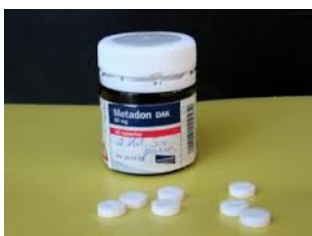
Slika 6. Metadon

Metadon je sintetički opijat s jako izraženim analgetskim učinkom, analgetik iz grupe difenilpropilamina. Po sastavu je hidroklorid i djeluje na morfinske receptore u mozgu, gdje 1 mg metadona zamjenjuje i postiže efekt 4 mg morfina. Metabolizira se u jetri, te se može pronaći u urinu.