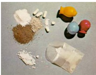
Slika 5. Heroin

Metadon je sintetički opijat s jako izraženim analgetskim učinkom, analgetik iz grupe difenilpropilamina. Po sastavu je hidroklorid i djeluje na morfinske receptore u mozgu, gdje 1 mg metadona zamjenjuje i postiže efekt 4 mg morfina. Metabolizira se u jetri, te se može pronaći u urinu.