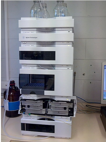
Slika 14. Tekućinska kromatografija s visokom djelotvornosti

4. Infracrvena spektrofotometrija (slika 15) jedna je od najspecifičnijih instrumentalnih metoda identifikacije. U praksi se ova metoda gotovo nikad ne koristi sama za identifikaciju, nego se dopunjuje sa drugim tehnikama (npr. masenom spektrofotometrijom). Riječ je o analizi spektara koji nastaju od molekulskih vibracija pri apsorpciji zračenja u infracrvenom dijelu spektra, vrši se uspoređivanje dobivenog infracrvenog spektra sa ranije snimljenim uzorkom određene droge, čime se ispitivani uzorak identificira (18).