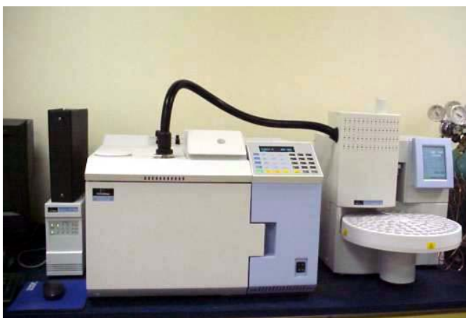
Slika 13. Plinska kromatografija s „head-space“

(slika 13), uzorak se drži dovoljno dugo na određenoj temperaturi dok se ne uspostavi ravnoteža između plinovite i krute/tekuće faze.