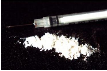
Slika 2. Kokain

Efedrin je psihostimulans po djelovanju sličan amfetaminu, a nekontrolirano uzimanje može uzrokovati moždani udar. Uzima se u kapima za nos i oralnim putem u obliku sirupa ili tablete. Zloupotreba efedrina ima brojne neželjene kratkotrajne i dugotrajne posljedice. Može nastupiti drhtanje ruku, tremor, znojenje, ubrzano kucanje srca i povišeni krvni tlak, vrtoglavica, mučnina, povraćanje, razdražljivost i osjećaj unutarnjeg nemira (8).