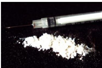
Slika 2. Kokain

Efedrin je psihostimulans po djelovanju sličan amfetaminu, a nekontrolirano uzimanje može uzrokovati moždani udar. Uzima se u kapima za nos i oralnim putem u obliku sirupa ili tablete. Zloupotreba efedrina ima brojne neželjene kratkotrajne i dugotrajne posljedice. Može nastupiti drhtanje ruku, tremor, znojenje, ubrzano kucanje srca i povišeni krvni tlak, vrtoglavica, mučnina, povraćanje, razdražljivost i osjećaj unutarnjeg nemira (8).