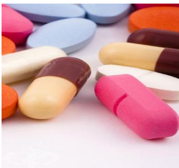
Slika 3. Barbiturati

Barbiturati se kao sedativi uzimaju oralno, intramuskularno, rektalno i intravenozno. Metaboliziraju se u jetri oksidacijom i konjugacijom, a izlučuju se putem bubrega. Test na barbiturate otkriva skupinu barbiturata među kojima su sekobarbital, pentobarbital i fenobarbital, odnosno barbiturati pod tvorničkim nazivima poput Phenobarbitona, Luminala i Phemitona. Test pritom ne može razlučiti koja vrsta barbiturata je konzumirana od 10 do 11 koliko ih se nalazi obično deklariranih u uputi za rukovanje testa (6).