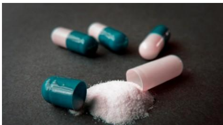
Slika 1. Amfetamin

Metamfetamini se pojavljuju u dva oblika: D i L izomerni oblici. D oblik je snažan stimulans SŽS-a i izaziva ovisnost. L oblik se može koristiti kao sredstvo za inhaliranje i ne izaziva ovisnosti. Test na amfetamin u urinu će detektirati i konzumente metamfetamina, ne zato jer je specifičan prema metamfetaminu, već iz razloga što se metamfetamin djelomično iz organizma izlučuje nepromijenjen, a dio metamfetamina se metabolizira i izlučuje u obliku amfetamina (7).