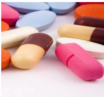
Slika 3. Barbiturati

Barbiturati se kao sedativi uzimaju oralno, intramuskularno, rektalno i intravenozno. Metaboliziraju se u jetri oksidacijom i konjugacijom, a izlučuju se putem bubrega. Test na barbiturate otkriva skupinu barbiturata među kojima su sekobarbital, pentobarbital i fenobarbital, odnosno barbiturati pod tvorničkim nazivima poput Phenobarbitona, Luminala i Phemitona. Test pritom ne može razlučiti koja vrsta barbiturata je konzumirana od 10 do 11 koliko ih se nalazi obično deklariranih u uputi za rukovanje testa (6).