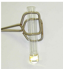
Slika 8. Duquenois-Levine test, korak 1., dodavanje Duquenois reagensa za sušenje petroletera

Primjer 1. Testiranje marihuane sa Duquenois-Levine testom. (slike 8, 9,10). Marihuana postaje ljubičasta nakon dodavanja Duquenois reagensa i klorovodične kiseline (14).