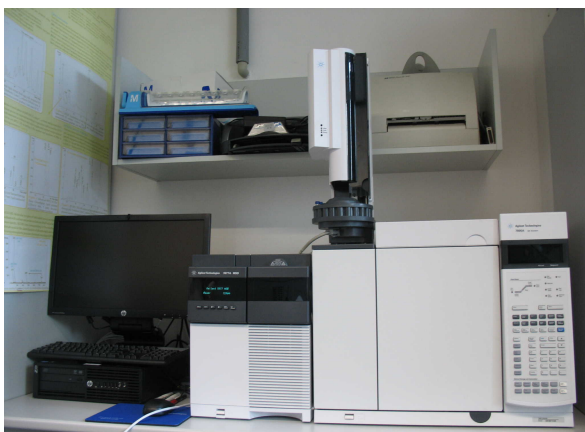
Slika 12. Plinska kromatografija sa masenim detektorom (GC-MS)