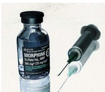
Slika 4. Morfin

Morfin je glavni alkaloid opijuma čiji su značajni učinci analgezija i sedacija. Primjenjuje se parenteralno, oralno, supkutano, intramuskularno i intravenski. Heroin se proizvodi jednostavnim kemijskim postupkom iz morfina (morfija), a nakon konzumacije u organizmu vrlo brzo se razgrađuje na drogu iz koje je i proizveden morfin.