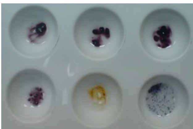
Slika 11. Rezultat reakcije heroinskog mix-a, amfetamina i MDMA sa Marquis reagens-om.