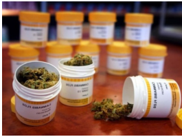
Slika 7. Kanabis

također mnogo lakše interpretirati jer ne postoje tetrahidrokanabinolu slične tvari u lijekovima ili hrani.