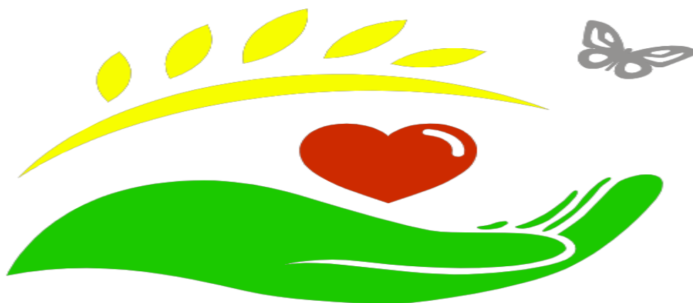
Slika 3: Palijativna skrb grafika

Edukacija zdravstvenih radnika o pravilnom razumijevanju i primjeni palijativne skrbi važna je iz razloga da pacijenti dobiju pravovremenu i sveobuhvatnu skrb koja odgovara njihovim potrebama, bez obzira na fazu bolesti. Integracija palijativne skrbi u praksu neurologa može značajno poboljšati kvalitetu života njihovih pacijenata.