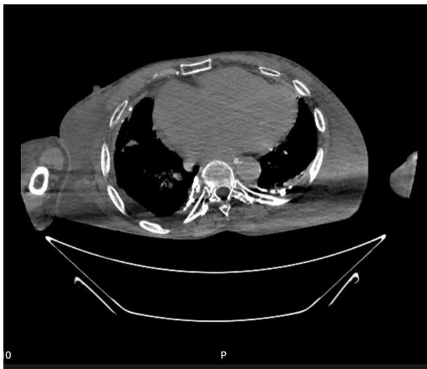
Slika 5. Artefakti kod spuštenih ruku prilikom CT snimanja

skenirati s podignutim rukama iznad glave, a hemodinamski nestabilne pacijente s rukama položenim uz tijelo kako bi se što više uštedjelo na vremenu [22].