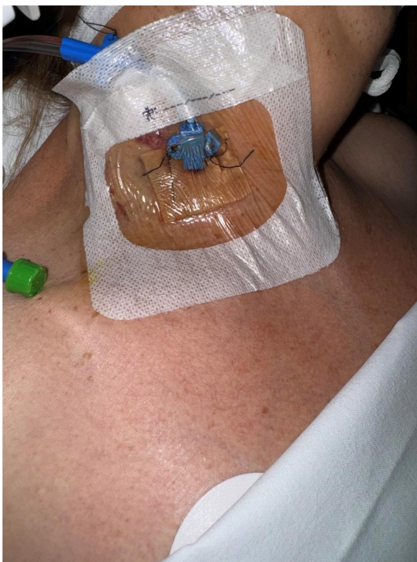
Slika 3. SVK postavljen u venu jugularis interna

Unutarnja jugularna vena često se koristi za postavljanje središnjeg venskog katetera, posebno u JIL-u. Nalazi se u vratu, blizu ključne kosti i vodi prema srcu. Time omogućava brz i siguran pristup desnom atriju, što je važno za mjerenje središnjeg venskog tlaka i primjenu intravenske terapije. U usporedbi s venom subklavijom, unutarnja jugularna vena je udaljenija od pluća, a time je manji rizik od slučajnog probijanja plućne ovojnice (pneumtoraks). Unutarnja jugularna vena je lako dostupna i dobro vidljiva pod ultrazvukom, što dodatno povećava sigurnost i preciznost (12).