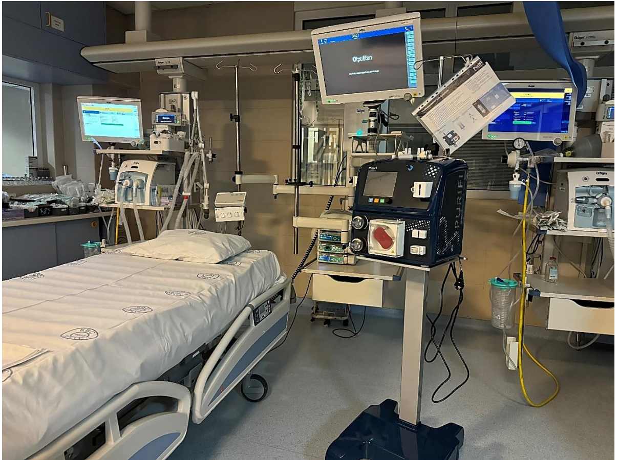
Slika 1. Jedinica intenzivnog liječenja KBC-a Split