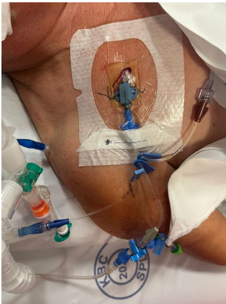
Slika 4. SVK postavljen u potključnu venu

Potključna vena vodi izravno u gornju šuplju venu (vena cava superior) i desnu pretklijetku srca. Uz unutarnju jugularnu venu, također se često odabire kao mjesto postavljanja SVK, omogućavajući brz i učinkovit unos lijekova i tekućina te praćenje središnjeg venskog tlaka. Potključna vena nalazi se dalje od područja s visokim rizikom od bakterijske kontaminacije, poput vrata ili prepona, što smanjuje rizik od kateter-povezanih infekcija. Postavljanje katetera u ovu venu nosi veći rizik od pneumotoraksa jer se vena nalazi blizu pluća, pa liječnik mora biti iznimno precizan tijekom postupka (13).