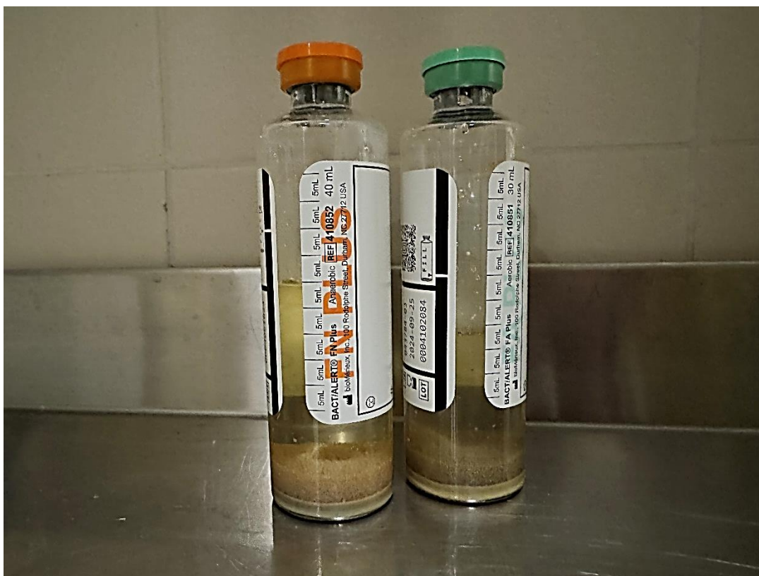
Slika 7. Set za hemokulturu

Pravilno održavanje katetera od iznimne je važnosti u prevenciji infekcija. To uključuje redovnu zamjenu sterilnih zavoja, pravilnu higijenu ruku prije i nakon svakog kontakta s kateterom te korištenje antiseptičkih otopina pri svakom otvaranju kateterskog sistema. Obzirom na visoki rizik od infekcija kod bolesnika sa SVK-om, zdravstveni djelatnici moraju biti iznimno pažljivi pri provođenju svih postupaka vezanih uz kateter, kako bi smanjili mogućnost bakterijske kolonizacije i kasnijih komplikacija (17).