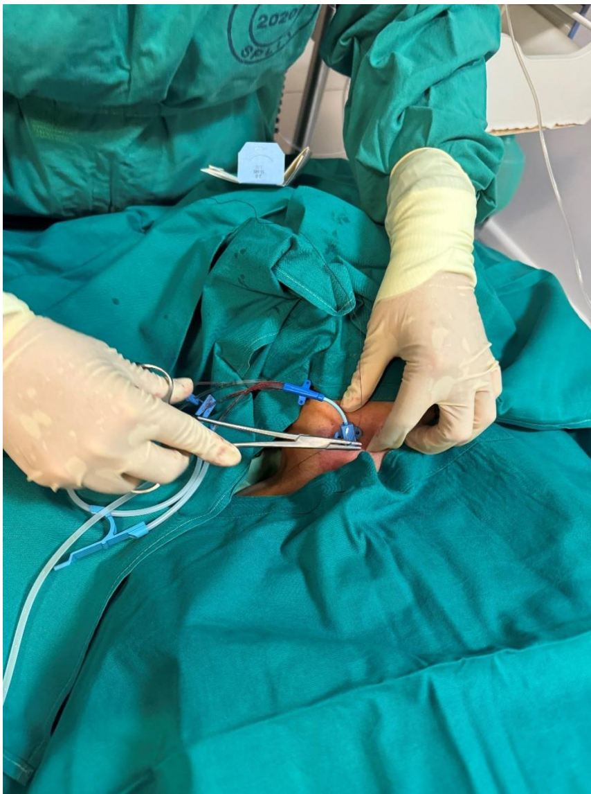
Slika 6. Postavljanje SVK u v.jugularis