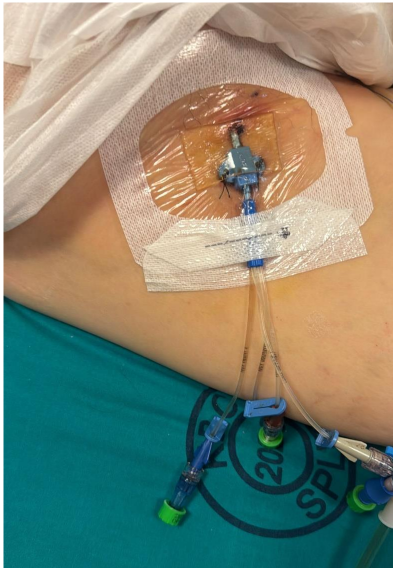
Slika 5. SVK postavljen u bedrenu venu

Postavljanje katetera u venu femoralis koristi se kod bolesnika u hitnim situacijama ili kada drugi pristupi nisu mogući. Njena prednost je jednostavan pristup, no postoji veći rizik od infekcija zbog blizine prepona i povećanog rizika od tromboze (11,13).