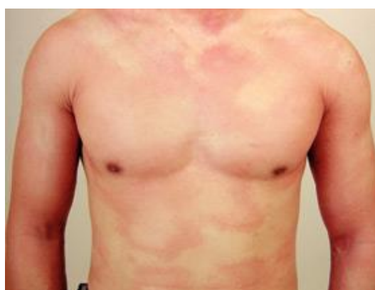
Slika 3. "Divovske urtike"