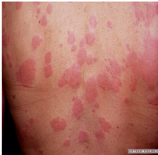
Slika 9. Kronična idiopatska urtikarija