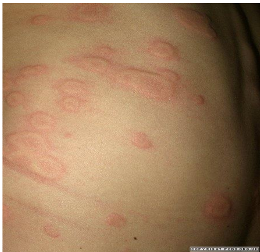
Slika 8. Kronična urtikarija

Ovisno o samom uzroku vrši se podjela kronične urtikarije. U većine bolesnika, uzrok ostaje nepoznat pa se tada naziva idiopatska kronična urtikarija (1).