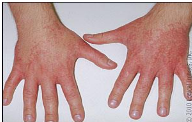
Slika 7. Akutna urtikarija

Akutna urtikarija najčešće kao uzrok ima hranu, lijekove (penicilin), pseudoalergene (ASA) i virusne infekcije respiratornog sustava. Prema Zuberbieru (2003.), u bolesnika s akutnom urtikarijom čak 50,2% ima atopijsku bolest (astma, rinitis, atopijski dermatitis). Akutna urtikarija se uglavnom javlja kod djece i mladih osoba (1).