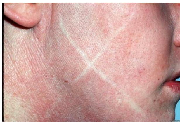
Slika 6. Dermografizam (bijeli)