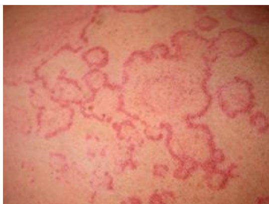
Slika 2. Urticaria annularis

Osim urtika, karakteristični simptomi su svrbež, febrilitet, bol, otekline, opća slabost te simptomi vezani za unutarne organe (gastrointestinalni i respiratorni simptomi). Klinička klasifikacija se temelji na etiologiji, trajanju i imunopatogenezi (kinetici i etiopatofiziologiji) (1).