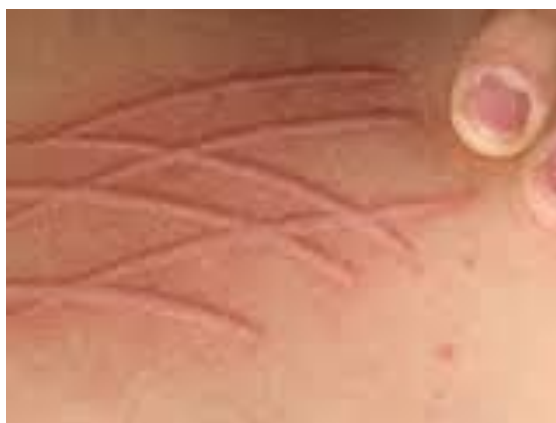
Slika 5. Dermografizam (crveni)

Ukoliko je dermografizam praćen svrbežom liječi se antihistaminicima, u protivnom terapija nije neophodna. Osobna higijena, izbjegavanje stresa, lokalna sredstva za hlađenje i smanjivanje svraba su dovoljni postupci za sučeljavanje s dermografizmom (8).