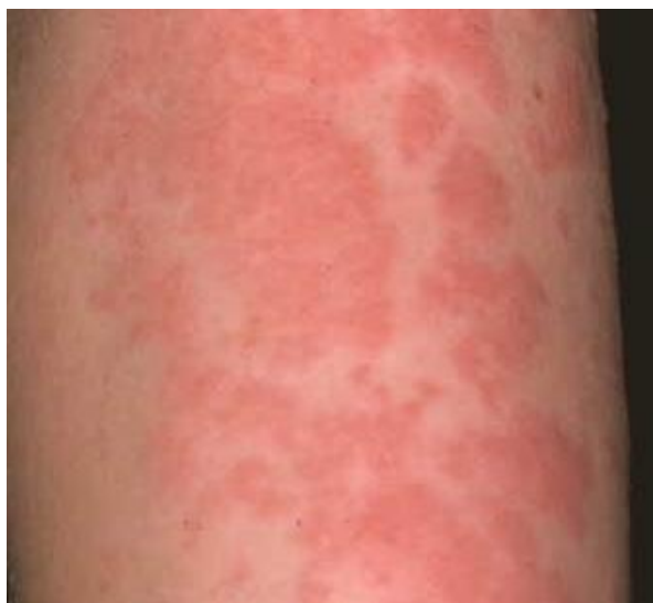
Slika 4. Urtica rubra