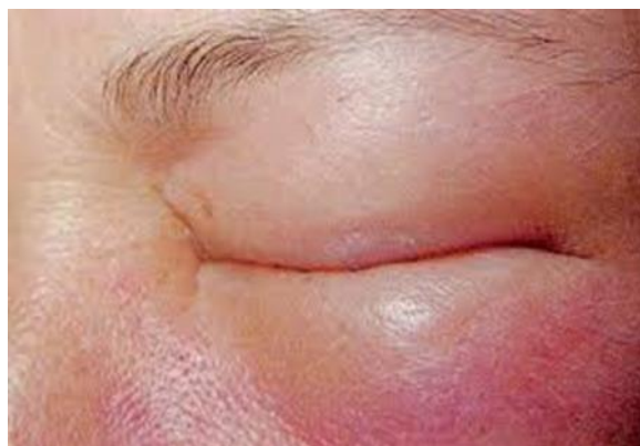
Slika 11. Angioedem vjeđe