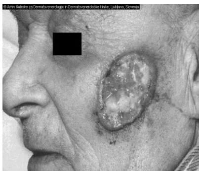
Slika 5. Ulcerozni oblik

Basalioma exulcerans se najčešće pojavljuje na koži, licu, uškama te potkoljenicama. Očituje se u obliku većeg ili manjeg ulkusa, koji često krvari te je pokriven krustama i granulacijama (slika 5). Diferencijalna dijagnoza mu je traumatski ulkus, a na potkoljenicama i hipostazički ulkus (1).