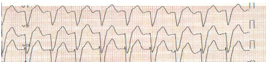
Slika 3. Ventrikularna tahikardija (VT)

Terapijski postupak kada nema pulsa na periferiji je isti kao VF“ (2).