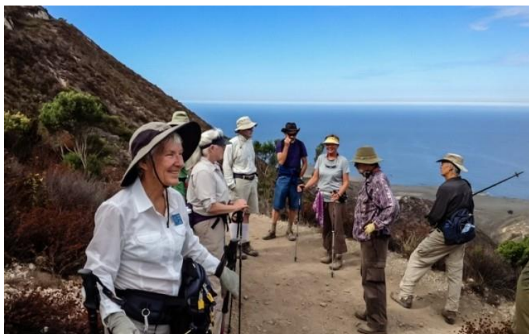
Slika 3. Organizirano druženje

Redovno kretanje i umjerene sportske aktivnosti čine dobro ne samo našem tijelu i našoj duši nego imaju dokazano pozitivan utjecaj i na kognitivnu sposobnost učinka i održanje svakodnevnih kompetencija. Tko rado planinari ili se vozi biciklom te ide plivati neka to čini i dalje koliko god je to moguće i to najbolje s prijateljima i poznanicima. Ako, međutim, postoje tjelesna funkcionalna ograničenja pri kretanju, onda fizioterapeuti mogu pogođene osobe kod aktivnog kretanja ciljano poduprijeti i to pojedinačno ili u grupi (10).