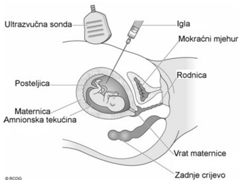
Slika 3. Amniocenteza

Trudnica leži na leđima. Nakon čišćenja kože trbuha pod kontrolom ultrazvuka liječnik uvodi tanku šuplju iglu unutar maternice u plodnu vodu. Kad igla dođe u dodir s plodnom vodom izvlači se mala količina tekućine. Ako se u maternici nalaze dva (ili više) fetusa često je potrebno uzimanje dva (ili više) uzoraka. Nakon uzimanja uzorka liječnik ultrazvukom provjerava jesu li uredni otkucaji fetalnog srca. Cijeli zahvat traje nekoliko minuta.