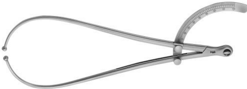
Slika 9. Pelvinometar

Mjeri se također i udaljenost između tuber ossis ischii,procjena šakom.