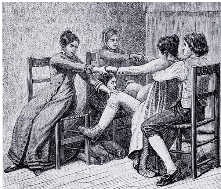
Slika 1. Povijest primaljstva

Porodništvo ili primaljstvo je najstarija medicinska struka, a često se govori da je staro koliko i samo čovječanstvo. Prateći povijesni razvoj društva i medicine, može se jasno uočiti da su zakonodavstvo, broj primalja i briga o roditeljima bez sumnje bili jedan od znakovitih pokazatelja razvojnog stupnja pojedine sredine, naroda pa i čitave epohe. Otac medicine Hipokrat u svojim tekstovima piše i o trudnoći pa tako spominje znakove trudnoće, a dijagnostiku trudnoće upotpunjuje i unutarnjim pregledom. U njegovim spisima ima i mnogo podataka o patologiji trudnoće i porođaja. On poznaje eklampsiju, opisuje prsnuće vodenjaka i posljedice koje iz toga slijede, ispad pupkovine, ovijanje pupkovine oko djeteta, razne nepravilne stavove i položaje djeteta. Zalaže se za okret na glavu, a opisuje i embriotomiju ako porođaj ne ide. Hipokrat spominje i simptome abortusa imminensa i habitualnog abortusa te njihove uzroke. Trudnoća i porođaj stoljećima su bili neizvjesnog ishoda bez primjerenog nadzora. Arapi su imali škole za primalje u srednjem vijeku, dok je u Europi razvoj školovanja počeo kasnije. Tek se u 16. stoljeću liječnici uključuju u porod. Prva škola za primalje otvorena je 1786. godine u Rijeci. Dokaz loših uvjeta i needuciranosti je i činjenica da bi pri svakom desetom porođaju umrla majka ili dijete, a nerijetke su bile i zdravstvene komplikacije koje su često ostavljale i tužne posljedice.