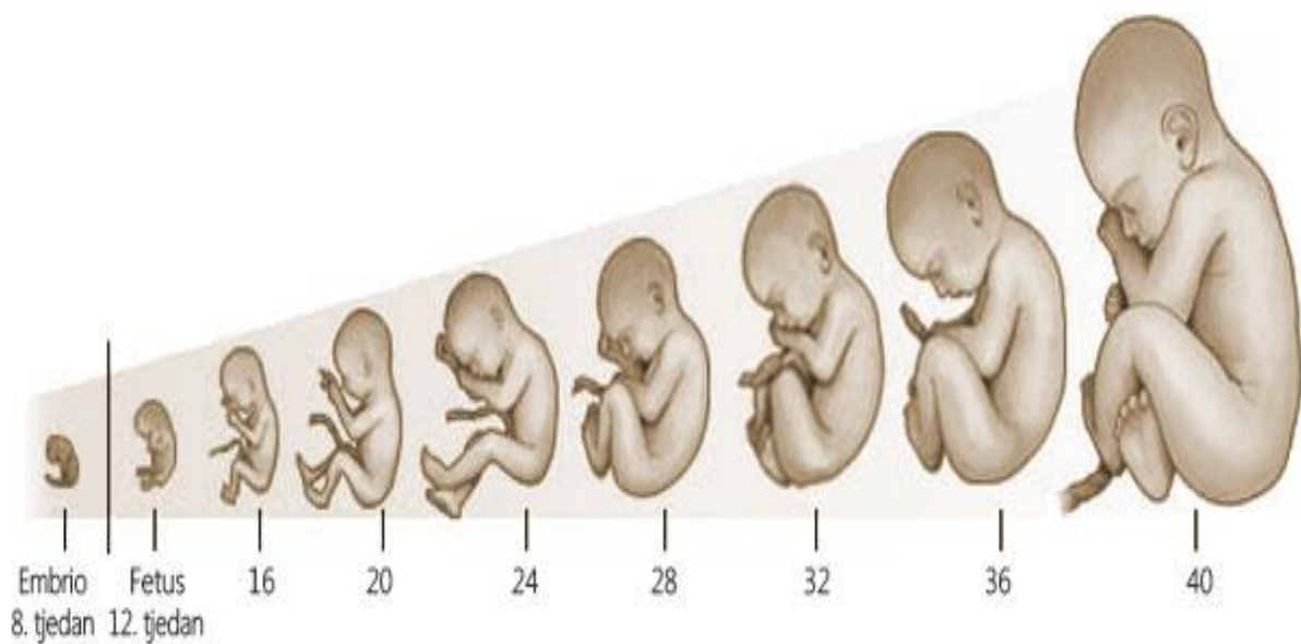
Slika 6. Fetalni rast

Danas osnovu praćenja rasta fetusa čini ultrazvučna biometrija. Od koristi je i mjerenje udaljenosti fundus-simfiza koji velik broj opstetričara rutinski određuje kod svakog ginekološkog pregleda u trudnoći. Ultrazvučne vrijednosti koje upućuju na rast fetusa uspoređuju se sa standardnim percentilnim krivuljama prilagođenima za populaciju,pariteti spol fetusa. Kako bi se mogla izvršiti kvalitetna ultrazvučna biometrija potrebno je što točnije odrediti gestacijsku dob kao i posjedovati standardizirane referentne percentilne krivulje za ispitavanu populaciju. U prvom trimestru određuje se veličina gestacijske vrećice (gestational sack-GS ),žumančane vrećice ( yolk sack – YS ) te udaljenost tkeme-zadak ( crown- rump length –CRL ), a u sklopu ranog probira na kromosomske anomalije i nuchalni nabor ( nuchal translucency – NT ). U drugom i trećem trimestru određuje se baparietalni promjer ( biparietal diameter –BPD ),omjer glavice (head circumference –HC),opseg abdomena (abdominal circumference –AO) i duljina femura ( femur length –FL ).u sklopu rasta i razvoja mogu se koristiti i neke druge metode kao što su pulzirajući dopler,omjer sfingomijelin/leicitin,određivanje biofizičkog profila.