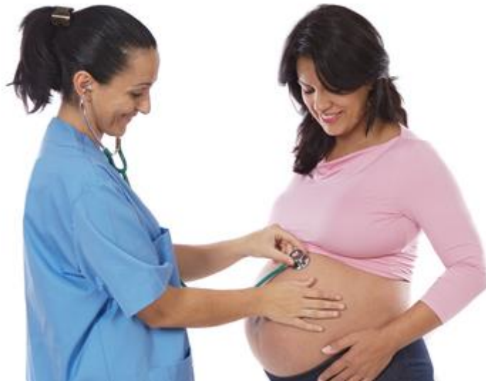
Slika 11. Primaljska skrb

Primalje moraju biti dobre u komunikaciji, jer dobar dio njihova posla uključuje pružanje psihološke potpore. Osobito je važno da mirno i sabrano komuniciraju s pacijenticama i članovima njihovih obitelji u okolnostima koje su obilježene visokim stupnjem napetosti, iščekivanja, nervoze i, uz sve to, preopterećenjem poslom. One moraju razumjeti što trudnoća, porođaj i novo dijete znače svakoj ženi i njezinoj obitelji. Također moraju biti svjesne raznolikosti reakcija, osjećaja i dvojbi koje se mogu izmjenjivati u kratkom, ali intenzivnom razdoblju neposredno prije, tijekom i poslije porođaja. S obzirom na uzbuđenje majki i nemogućnost verbalne komunikacije novorođenčadi, važno je da primalje budu savjesne u promatranju i dobre u opažanju simptoma i znakova koji upućuju na komplikacije. Sudjelovanje u raznim medicinskim postupcima, važnost sprečavanja intrahospitalnih infekcija i poslovi povezani s njegom novorođenčeta zahtijevaju spretnost. Primalja mora biti kadra samostalno obavljati poslove iz svoga djelokruga, surađivati s drugim članovima tima i prepoznati kada se javi problem koji prelazi okvire njezine nadležnosti.