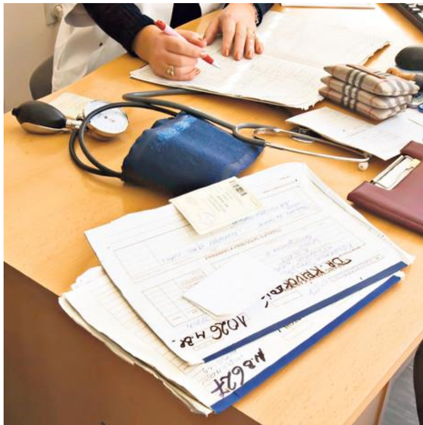
Slika 10. Ispisivanje medicinske dokumentacije

Primalja također ispunjava i osobne podatke pacijentice na potrebnim uputnicama i vodi evidenciju novoprimljenih te otpuštenih trudnica s odjela.