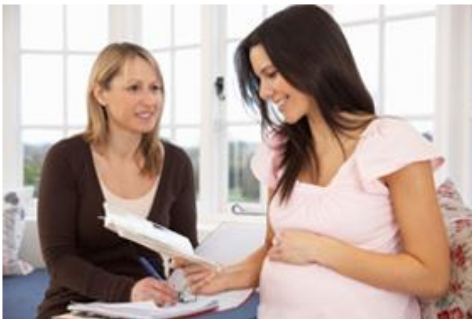
Slika 4. Prikupljanje podataka

Bitno je s pacijenticom uspostaviti uzajamno povjerenje radi lakše komunikacije i suradnje. Pred kraj razgovora, preporuča se iznijeti sažetak te pitati pacijenticu želi li još nešto nadodati ili ispraviti.