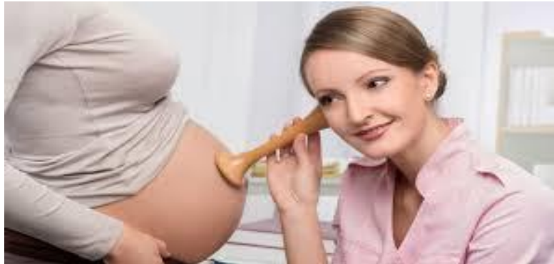
Slika 5. Slušanje otkucaja bebinog srca

Sigurni znaci trudnoće su postojanje fetusa vidljivog ultrazvučnim nalazom, slušanje srčanih tonova(KČS), opipavanje dijelova tijela ploda i prisustvo hormona trudnoće u urinu.