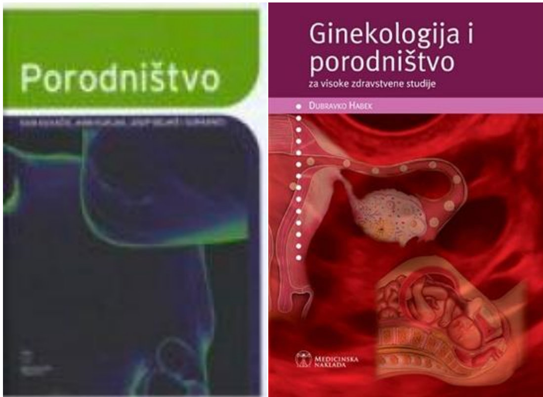
Slika 2. i 3. Stručna literatura

liječnika ograničena je na predlaganje određenog postupka i tumačenje kakve su šanse da stvari postanu bolje, ali i gore.