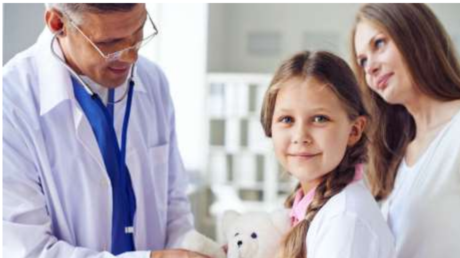
Slika 1. Prikaz obavljanja preventivne zaštite djece od strane obiteljskog liječnika kao dio primarne zdravstvene zaštite

Primarna zdravstvena zaštita je prvi i najčešći oblik kontakta stanovništva sa zdravstvenom službom, a obuhvaća praćenje zdravstvenog stanja stanovništva, unapređenje zdravlja, sprečavanje i otkrivanje bolesti, preventivnu zaštitu djece školske dobi, zaštitu žena i osoba starijih od 65 godina, osoba s invaliditetom, te ostalih rizičnih skupina. Obuhvaća i higijensko–epidemiološku, stomatološku, psihološku zaštitu, patronažne posjete, medicinu rada, hitnu medicinu, palijativnu skrb, sanitetski prijevoz, telemedicinu te opskrbu s lijekovima i medicinskom opremom. Ovaj oblik zaštite provodi se u timu u kojem najmanje mora biti zdravstveni radnik sa završenim diplomskim studijem i radnik prvostupnik ili sa srednjom stručnom spremom.