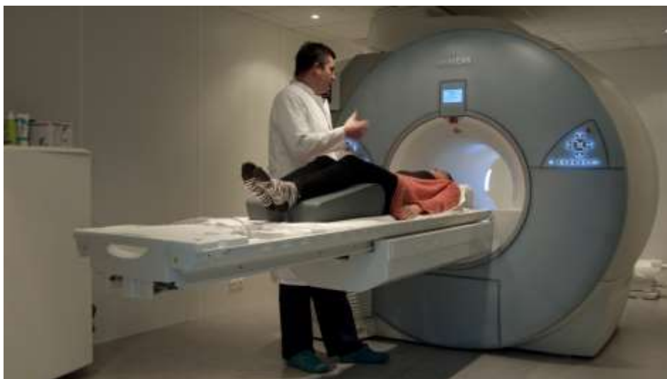
Slika 10. Radiološki tehnolog priprema pacijenta za pretragu na MR-u