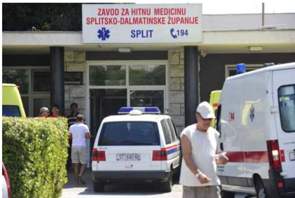
Slika 3. Prikaz Zavoda za hitnu medicinu Splitsko-dalmatinske županije kao dijela primarne zdravstvene zaštite