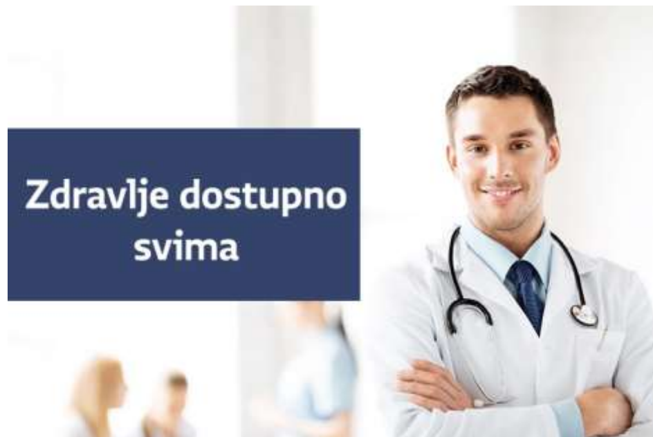
Slika 9. Slogan Zakona o zdravstvenoj zaštiti – zdravlje treba biti dostupno svima u skladu sa zakonskim načelima