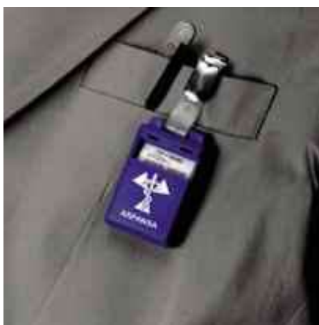
Slika 15. Prikaz dozimetra koji detektira ionizirajuće zračenje te je sastavni dio radnog odijela radiološkog tehnologa