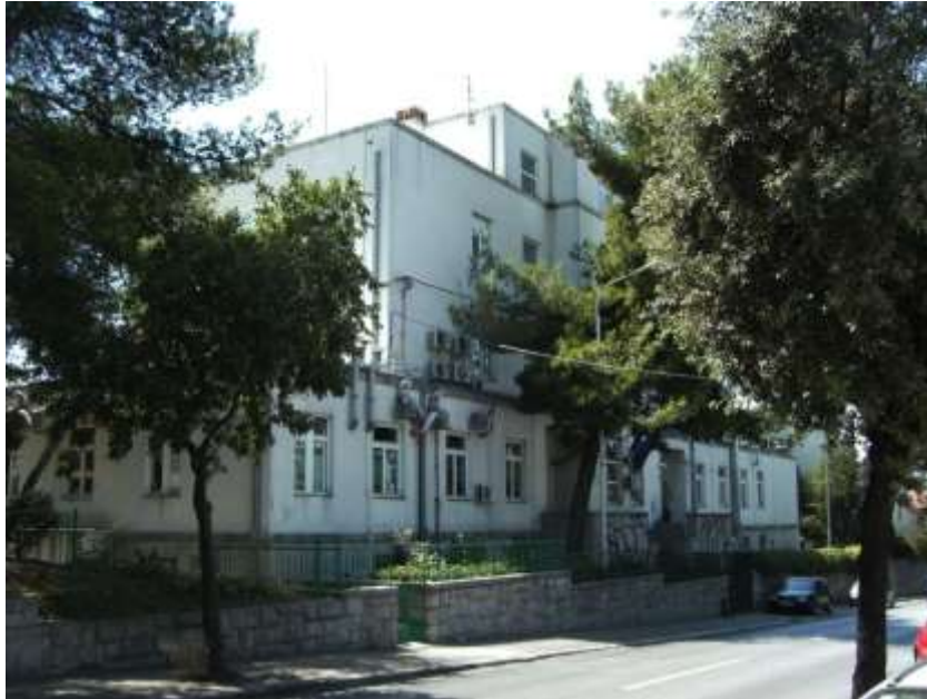
Slika 2. Nastavni zavod za javno zdravstvo Splitsko-dalmatinske županije u kojem se nalazi higijensko–epidemiološka služba za stanovništvo