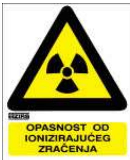
Slika 14. Znak koji upozorava opasnost od ionizirajućeg zračenja, a nalazi se na svim uređajima ili nuklearnim tvarima koji ga emitiraju