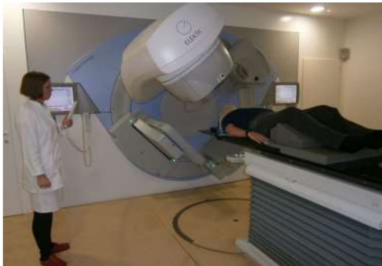
Slika 13. Prikaz pripremanja onkološkog bolesnika za radioterapiju

Radiološki tehnolog će načiniti svaki mogući napor kako bi zaštitio sve korisnike usluga od nepotrebnog zračenja. Ovaj princip zahtijeva od radiološkog tehnologa pridržavanje ALARA principa ( As Low As Reasonably Achievable , tj. prilikom izvođenja dijagnostičkih i radioterapijskih postupaka koristi se najmanja moguća količina zračenja koja je potrebna da bi se dobio zadovoljavajući rezultat). Također zahtijeva i uporabu različitih sredstava i mjera za zaštitu od zračenja. Pod sredstvima zaštite od zračenja smatra se uporaba pregača, kolimatora i ostalih štitnika od zračenja, a pod mjere zaštite od zračenja podrazumijeva se pravilna mjera i odabir faktora ekspozicije i ostalih znanstvenih dostignuća. (13)