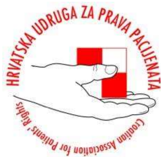
Slika 12. Logo udruge za prava pacijenata u Hrvatskoj gdje se pacijenti mogu informirati o svojim pravima