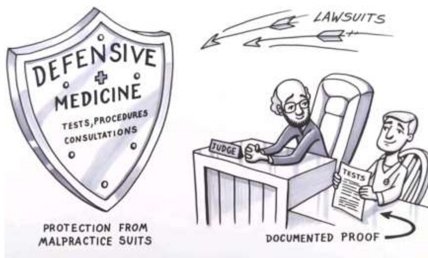
Slika 16. Karikaturni prikaz funkcioniranja sustava „Defensive Medicine“

Članak 10. Zakona o zaštiti prava pacijenta navodi: „Pacijent ima uvijek pravo tražiti drugo stručno mišljenje o svome zdravstvenom stanju...“ (8) Bitan je individualni pristup svakog zdravstvenog radnika prema pacijentu. Isto tako, ne može ni pravo dati sve odgovore i zbog toga postoje pravne praznine te granice profesionalne odgovornosti, a šire se i na područje koje se odnosi na organizaciju zdravstvenog sustava, a ne samo na kvalitetu pružene usluge od strane zdravstvenog radnika kao pojedinca.