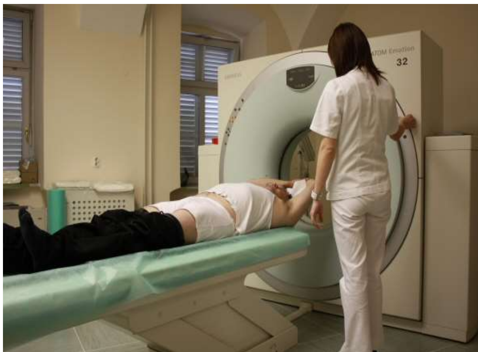
Slika 8. Prikaz radiološkog tehnologa, kao zdravstvenog radnika, koji namješta pacijenta za ispravnu pretragu na CT uređaju

Zdravstvena djelatnost je djelatnost od posebnog značaja u Republici Hrvatskoj, stoga je nužna detaljna zakonska regulativakako obrazovanja, tako i stručnog usavršavanja. Srednje škole i fakulteti su odgovorni za edukaciju zdravstvenog radnika. Dužni su im olakšati usvajanje znanja i vještine iz suvremene medicine, ali i omogućiti razumijevanje tehnološkog i organizacijskog procesa. Zbog toga svega postoje različiti pravilnici i zakoni od kojih je najvažniji onaj o zdravstvenoj zaštiti, kao i brojni strukovni zakoni o kojima ćemo govoriti u sljedećoj cjelini.