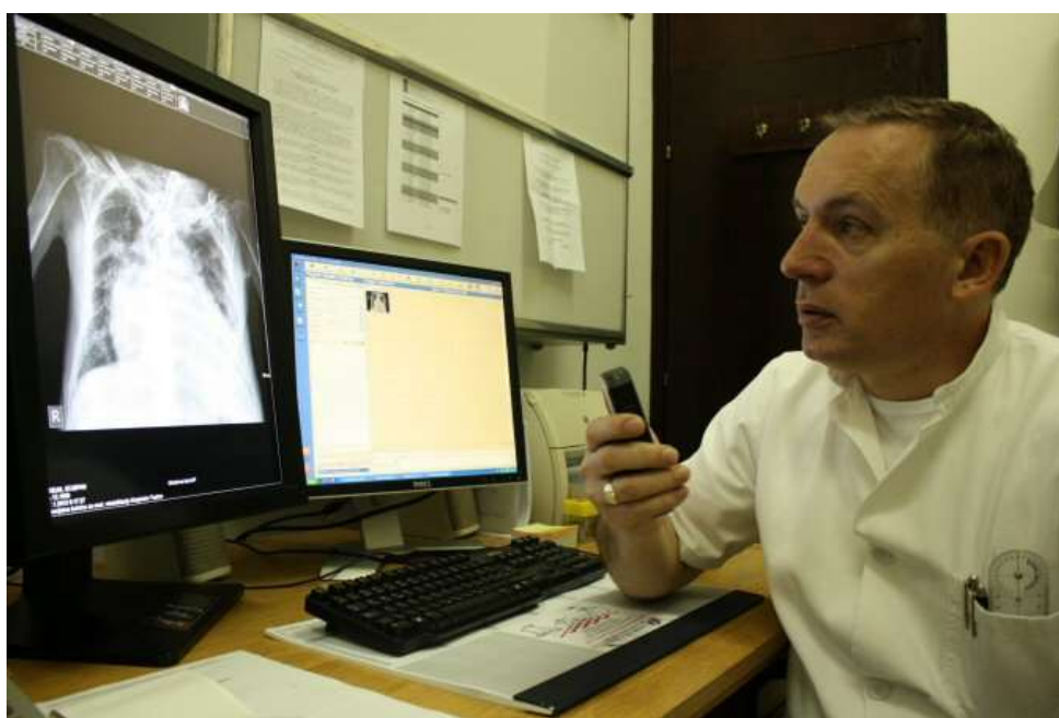
Slika 6. Specijalist radiologije proučava nalaze pretrage u sklopu sekundarne zdravstvene zaštite na temelju uputnice liječnika iz primarne zdravstvene zaštite

Najčešće liječnik primarne zdravstvene zaštite upućuje bolesnika na specijalističko-konzilijarni pregled nakon obrade, a na uputnicu upisuje razlog upućivanja, odnosno konzilijarno mišljenje ili zahvat koje traži. Konzilijarni liječnik daje mišljenje i nalaz nakon provedenoga dijagnostičkog postupka, mišljenje o terapijskom ili rehabilitacijskom postupku te mišljenje o prognozi bolesti i stanja.