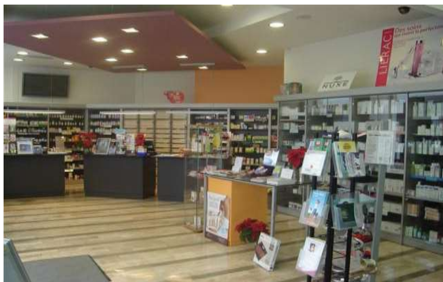
Slika 5. Ljekarna, kao dio primarne zdravstvene zaštite, pruža opskrbu s lijekovima i medicinskom opremom