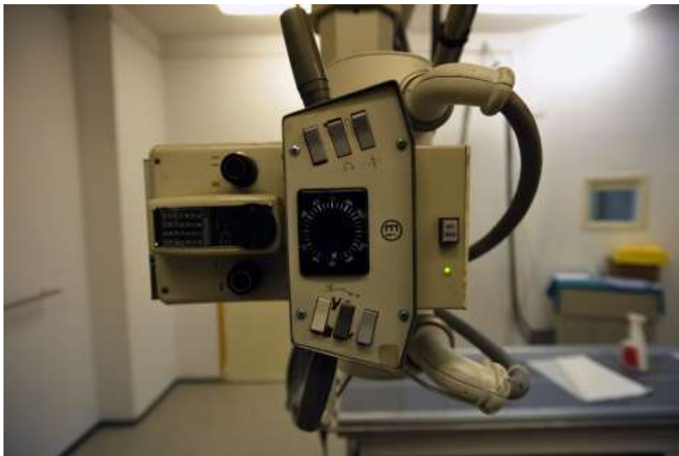
Slika 18. Prikaz RTG uređaja kao jednog od medicinskih uređaja koji ulazi u gore navedene članke

Primjenjuju li se na te štete, po našem odštetnom pravu, pravila subjektivne ili objektivne odgovornosti, ovisi o kvalifikaciji uređaja kao opasne stvari. Ako se uređaj može kvalificirati, prema sudu, kao opasna stvar, onda ustanova odgovara prema pravilima objektivne odgovornosti. U tom slučaju, ne zahtijeva se krivnja osobe koja je rukovala uređajem. Opasne stvari su one koje su po svojoj namjeni, osobinama, položaju, mjestu i načinu uporabe predstavljaju povećanu opasnost nastanka štete za okolinu.