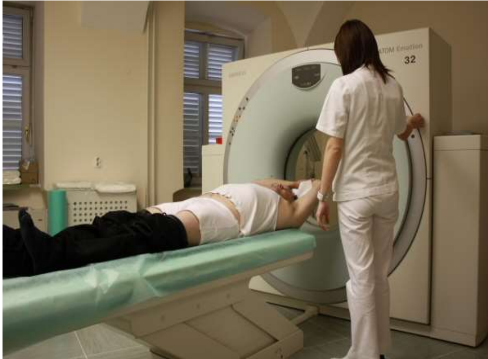
Slika 8. Prikaz radiološkog tehnologa, kao zdravstvenog radnika, koji namješta pacijenta za ispravnu pretragu na CT uređaju

Zdravstvena djelatnost je djelatnost od posebnog značaja u Republici Hrvatskoj, stoga je nužna detaljna zakonska regulativakako obrazovanja, tako i stručnog usavršavanja. Srednje škole i fakulteti su odgovorni za edukaciju zdravstvenog radnika. Dužni su im olakšati usvajanje znanja i vještine iz suvremene medicine, ali i omogućiti razumijevanje tehnološkog i organizacijskog procesa. Zbog toga svega postoje različiti pravilnici i zakoni od kojih je najvažniji onaj o zdravstvenoj zaštiti, kao i brojni strukovni zakoni o kojima ćemo govoriti u sljedećoj cjelini.