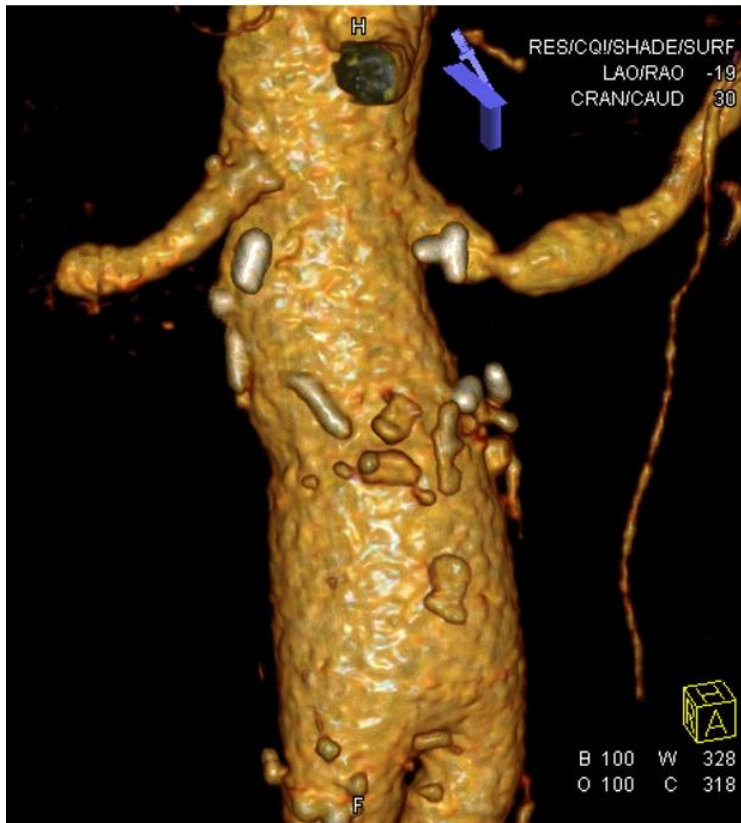
Slika 2. MSCT angiografija (VRT rekonstrukcija): stenoza početnog segmenta lijeve renalne arterije.