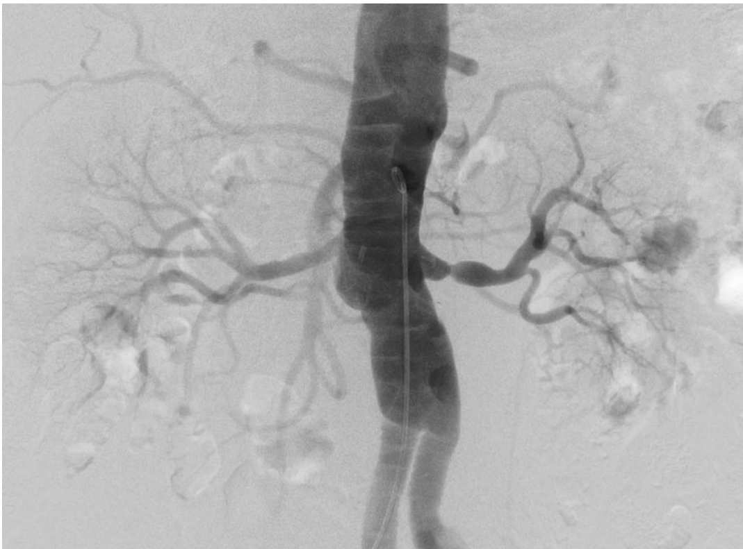
Slika 3. DSA aortografija: stenozna lijeve renalne arterije.

DSA zahtijeva suradnju pacijenta, koji mora mirovati i zadržati dah, jer svaka vrsta pokreta, kao što je pomicanje tijela, srčana pulzacija, disanje i peristaltika, uzrokuje značajnu degradaciju slike. Kod pacijenata koji nisu u mogućnosti stajati mirno i zadržati dah, ponekad je bolje dobiti ove digitalne projekcije bez subtrakcije. Postoje razni postupci za naknadnu obradu koji se mogu koristiti za poboljšanje slike.