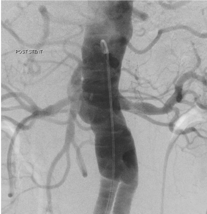
Slika 5. Kontrolna DSA: stanje nakon stentiranja stenozne lijeve renalne arterije. Prikazuje se uredno pozicioniran i prohodan stent, arterija je primjerene širine.

prikazuje na dijaskopskom ekranu (Slika br. 5.). Kod umetanja stenta u renalne arterije najčešće se koriste Palmaz-Schatz balonom šireći stent. Na tržištu postoji stalno napredovanje i usavršavanje pribora za angioplastiku u želji za boljim i dugotrajnijim rezultatima. Tako je nastala krvožilna proteza ili drugim nazivom stent-graft. Građena je od metalnog mrežastog stenta koji je presvučen nepropusnim materijalom koji može spriječiti hiperplaziju neointime.